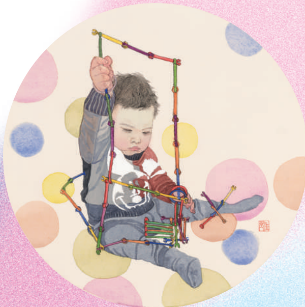
▲中国画《幼童轻岁月》,作者何佳豪。