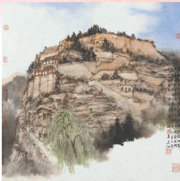
▲中国画《延安写生》,作者于文江。