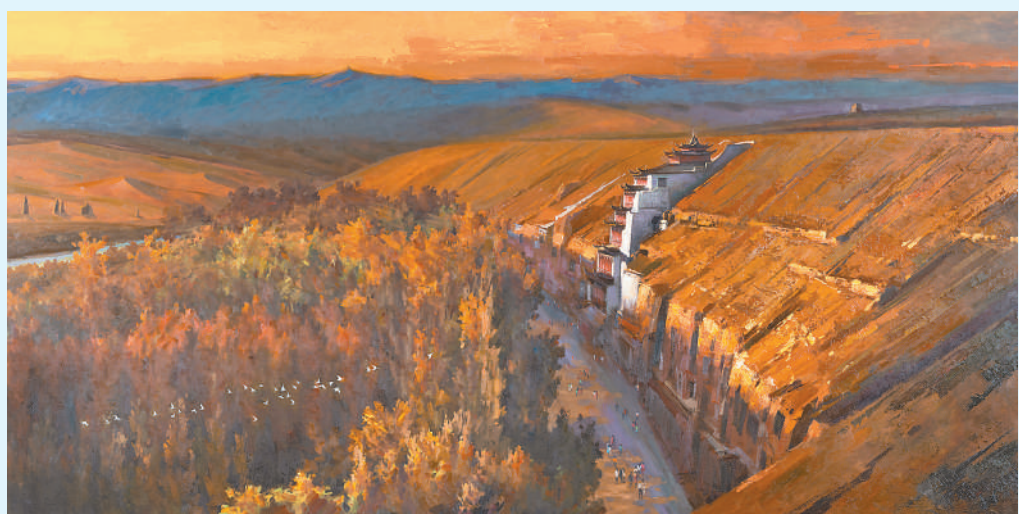
▲油画《小院》,作者陈和西。 ▲油画《秋染美高窟》,作者李宝堂。