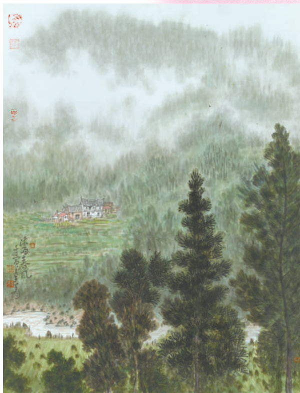
▲中国画《沐雨春风》,作者李翔。