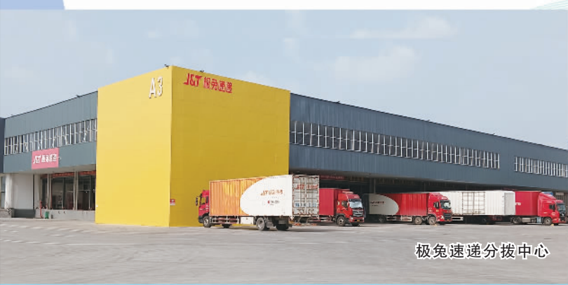
极兔速递分拨中心