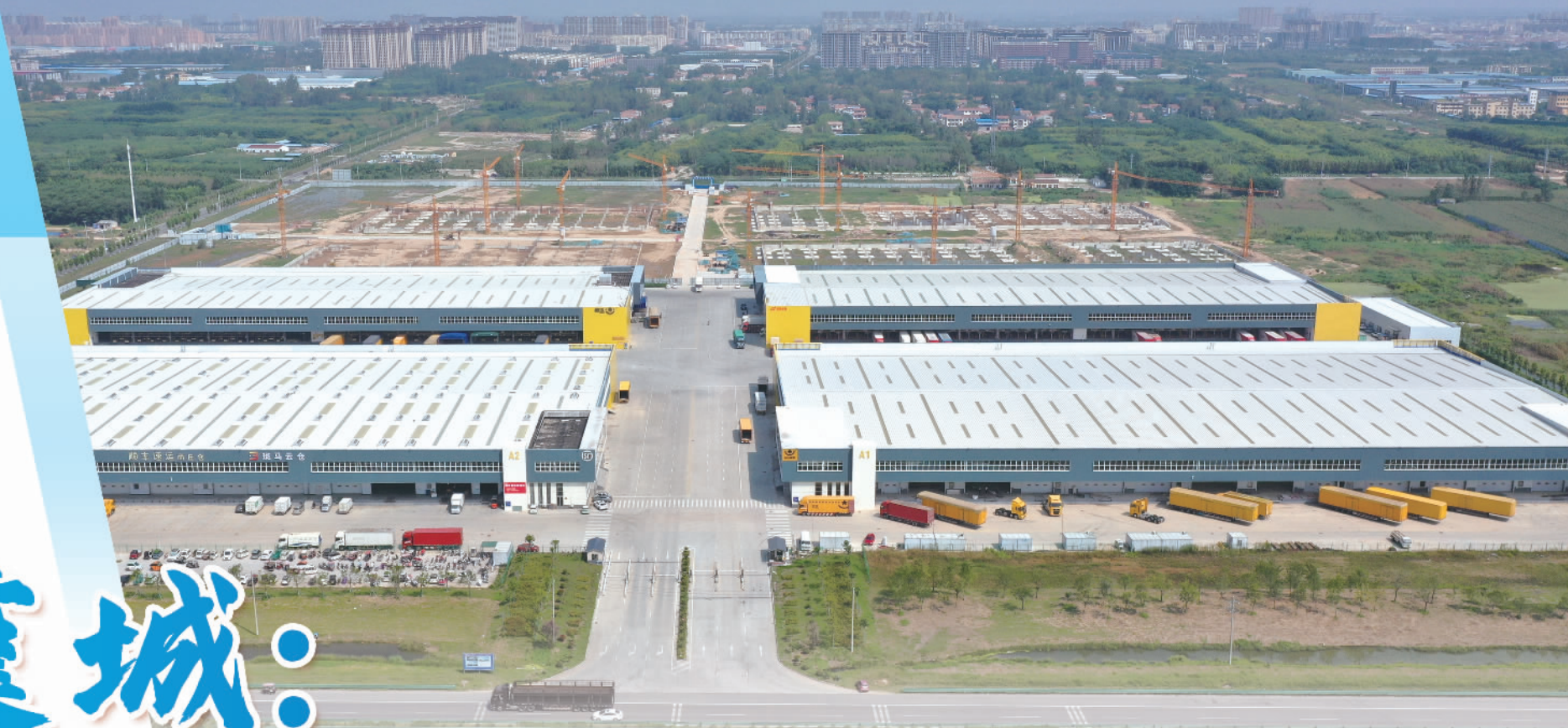
商丘电商物流产业园鸟瞰图