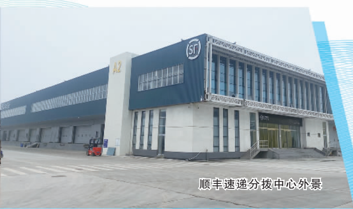
顺丰速递分拨中心外景