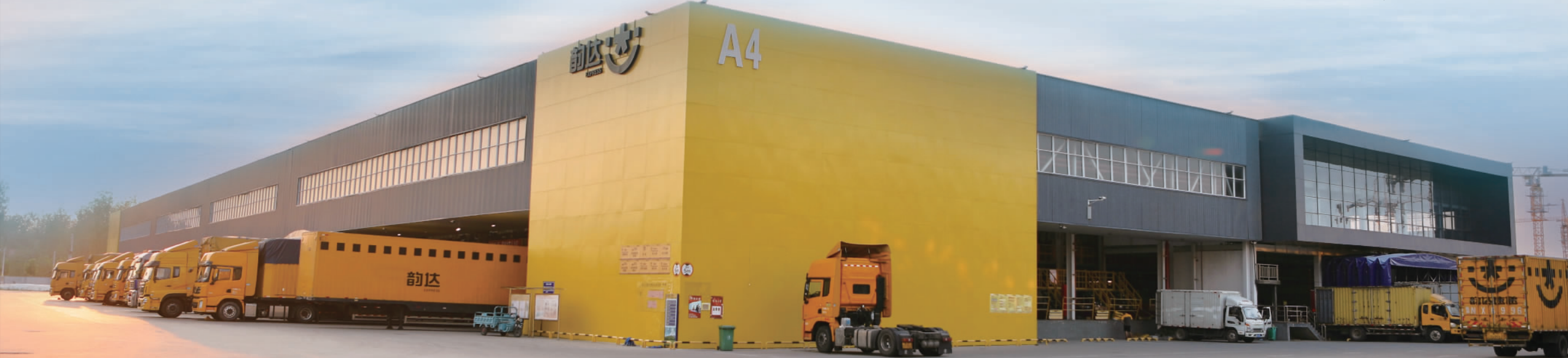
韵达速递分拨中心