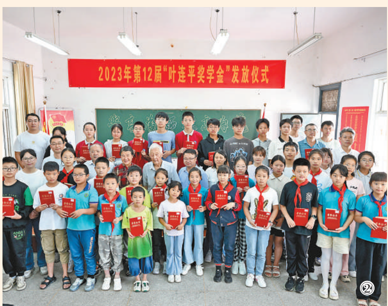
图①:叶连平在“未成年人之家”给孩子们上英语课。 图②:在奖学金发放仪式上,叶连平和获奖学生合影留念。