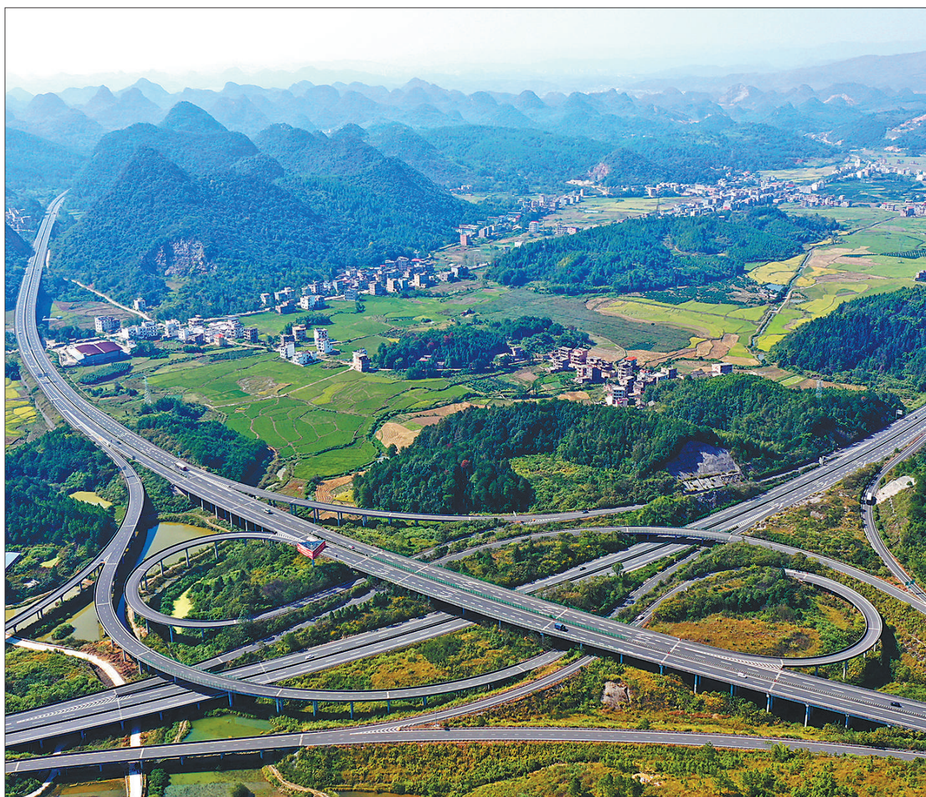
11月1日,湖南省蓝山县,高速公路在青山田野间延伸。近年来,湖南大力推进交通基础设施建设,完善立体交通布局,形成了内外衔接、城乡互通、四通八达的交通网络格局,助推地方经济高质量发展。