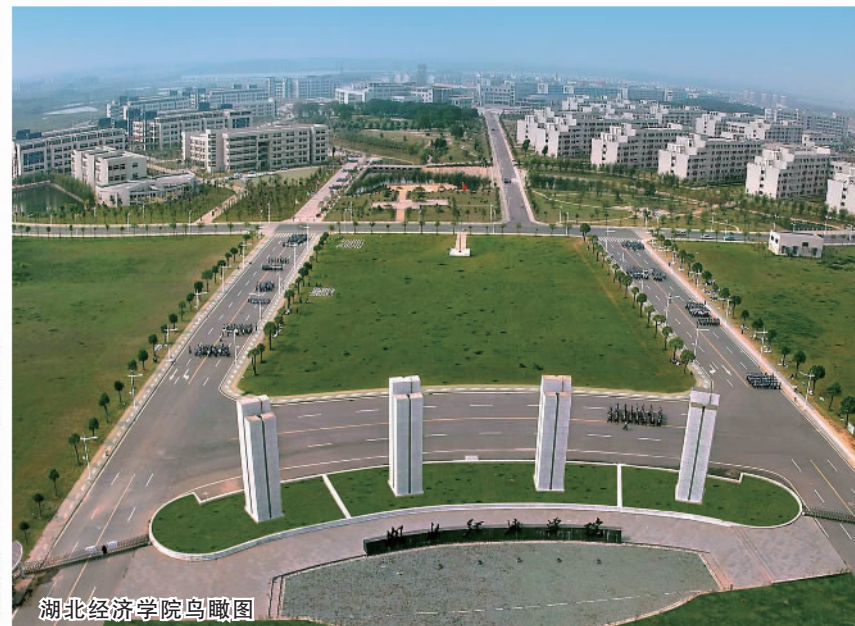
湖北经济学院鸟瞰图