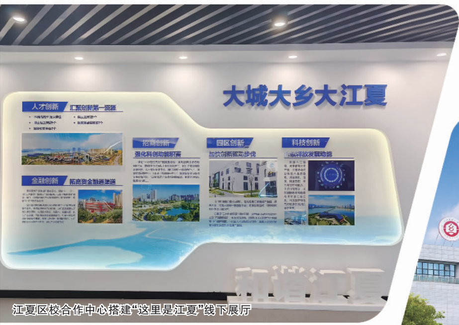
江夏区校合作中心搭建“这里是江夏”线下展厅