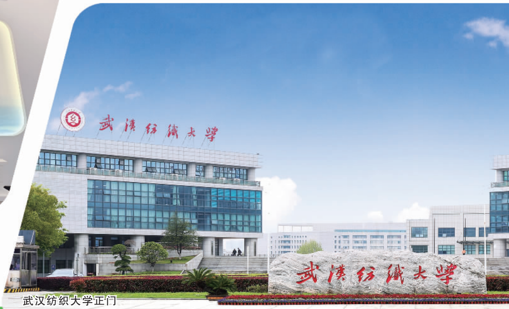
武汉纺织大学正门