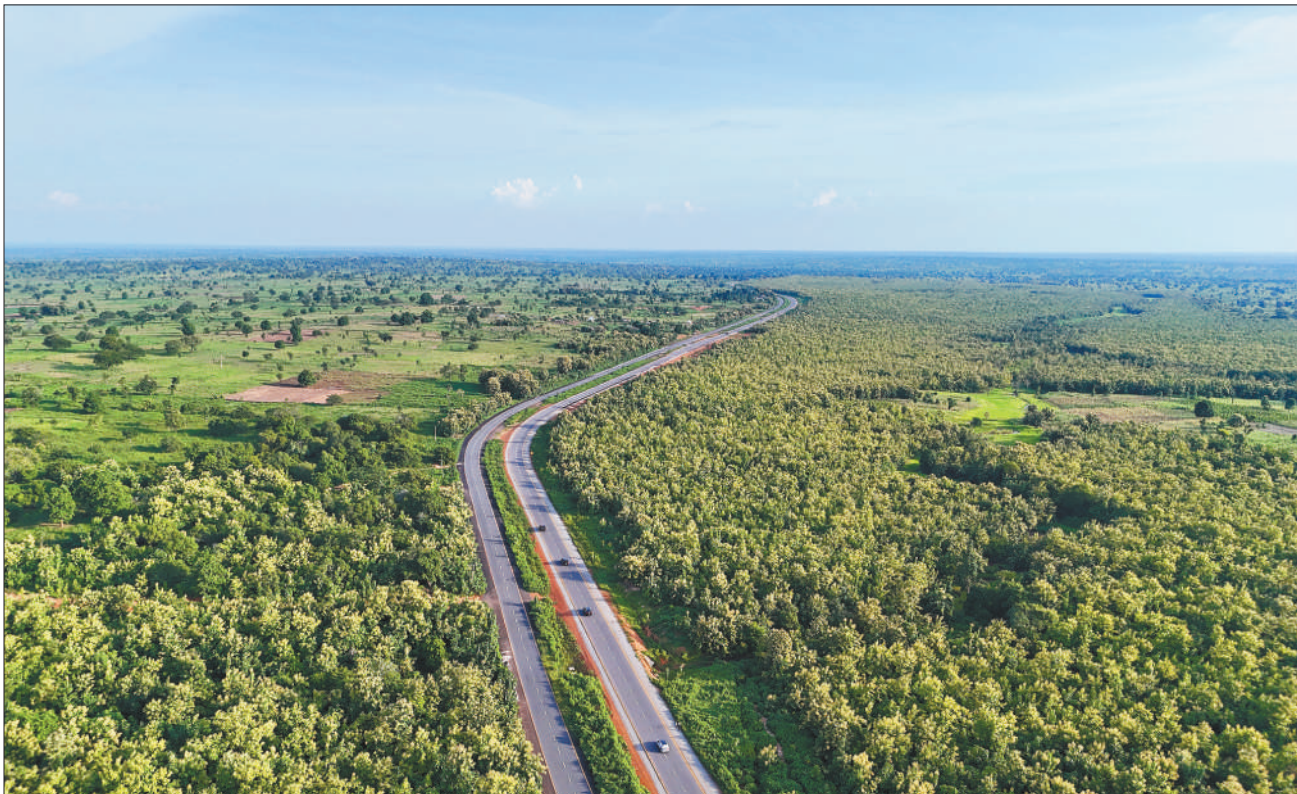
由中国港湾公司承建的尼日利亚凯菲至马库尔迪公路改扩建工程一期项目于2019年开工,2023年竣工。该项目包含阿布贾—凯菲5.4公里和凯菲—马库尔迪221.8公里改扩建公路两部分,因途经城镇凯菲而得名凯菲路。该工程为当地居民与货物通行带来了许多便利,并为当地提供了就业机会,培养了公路建设人才。图为凯菲路一景。

新华社霍尼亚拉10月29日电 10月27日至29日,中联部副部长郭业洲率中共代表团访问所罗门群岛。其间,“我们的党”领袖、政府总理索加瓦雷会见。代表团还分别与“我们的党”副领袖、矿业部长托沃西亚,外长马内莱及议会主要政党代表进行交流。双方一致认为,两国各领域合作蓬勃发展,证明中所建交符合两国人民根本利益,愿继续加强政党交流,推动两国关系行稳致远。