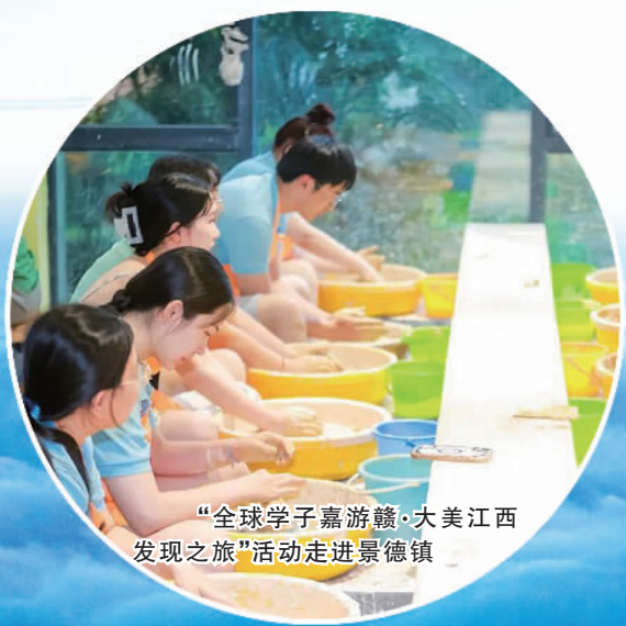
“全球学子嘉游赣·大美江西发现之旅”活动走进景德镇