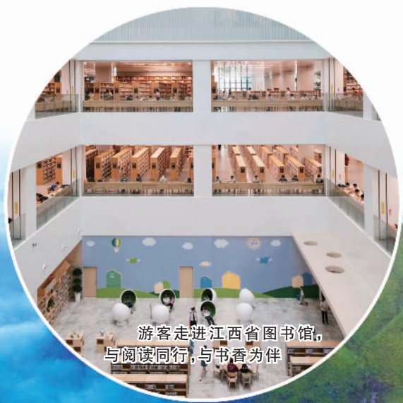
游客走进江西省图书馆,与阅读同行,与书香为伴