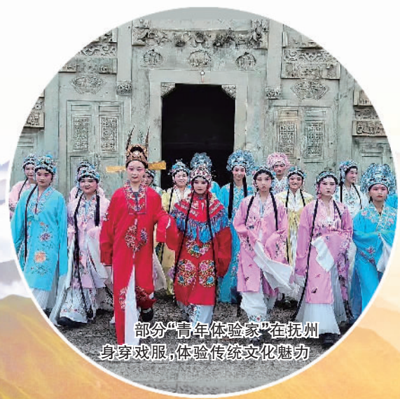
部分“青年体验家”在抚州身穿戏服,体验传统文化魅力