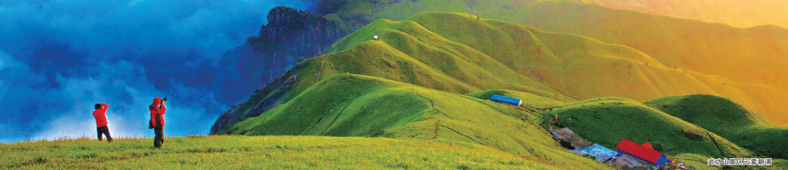
武功山景区云雾翻涌