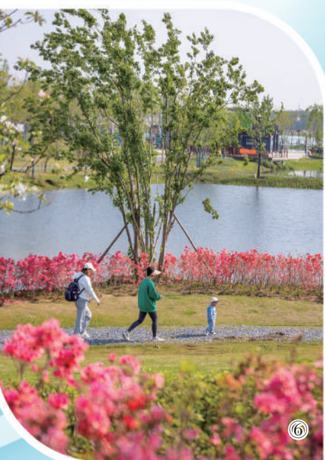
图①：耸立于武汉武昌蛇山的黄鹤楼。 图②：武汉市黄陂区的木兰花园田园综合体。 图③：武汉首个矿山主题景区——江夏灵山生态文化旅游景区。 图④：武汉文旅集团农文旅项目林语未来村·乡耕艺境。 图①至图④为本报记者陈斌摄 图⑤：杜公湖科普馆。 图⑥：杜公湖国家湿地公园。 图⑤、图⑥为东西湖区宣传部供图

挑战户外极限泵道，体验一站式采摘果园，畅游滨水绿道，每到节假日，东西湖区府河沿岸