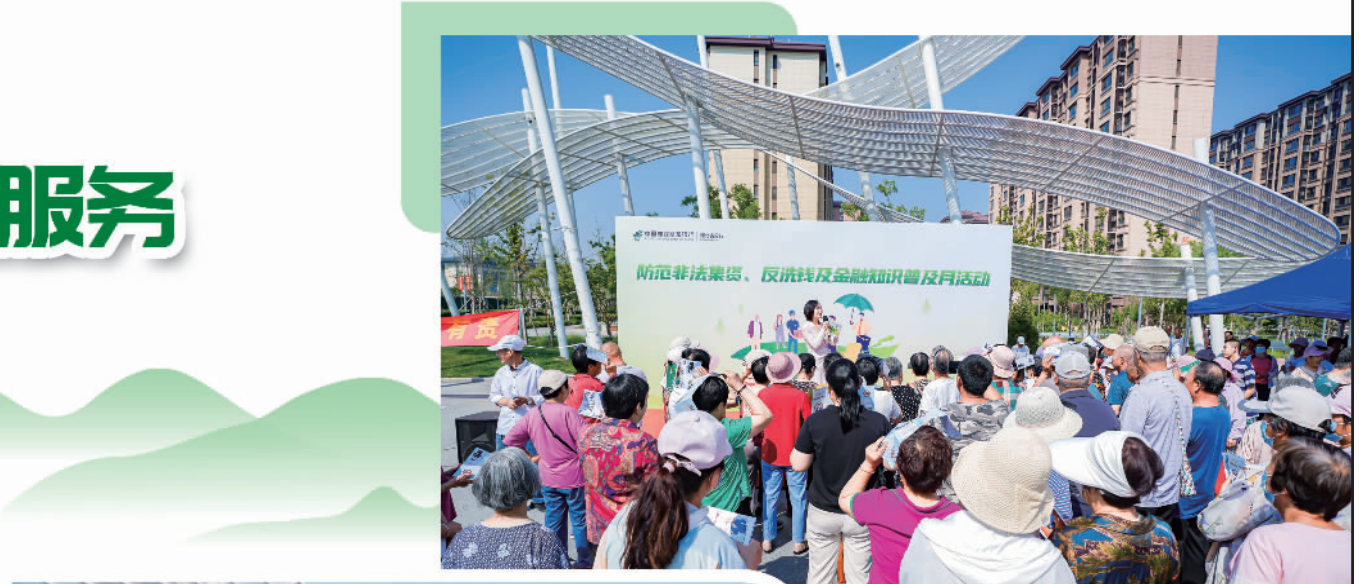
邮储银行河北省分行在雄安新区容东安置区社区广场开展金融知识普及活动

此外，邮储银行河北省分行还在打造舒适环境、提高客户服务质量、营造良好氛围方面下功夫，开展