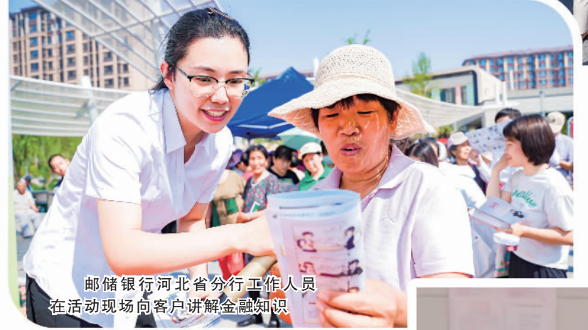
邮储银行河北省分行工作人员在活动现场向客户讲解金融知识