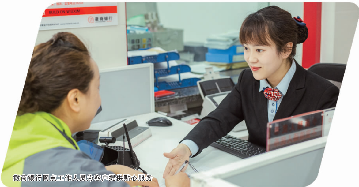
徽商银行网点工作人员为客户提供贴心服务

助力基础设施互联互通,徽商银行向滁宁城际铁路、合肥和南京轨道交通、肥东白龙机场等长三角地区重点基建项目投放30亿元。截至今年9月末,基础设施贷款余额突破2400亿元。