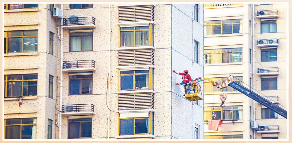
上图：改造老旧小区，提升百姓获得感。江苏省宿迁市宿城区古城街道府前社区，工人对小区外墙实施修补防水作业。