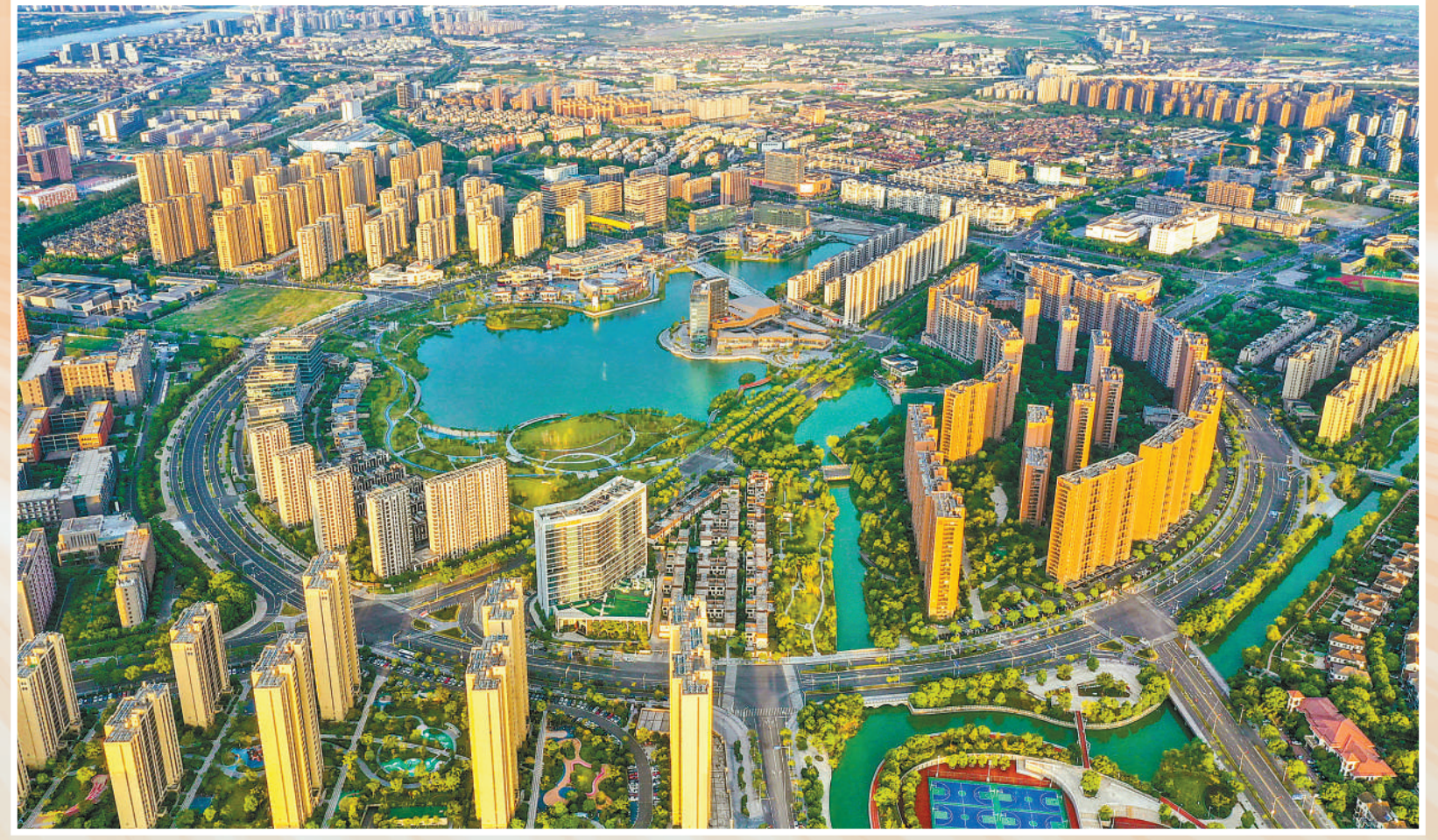
提高城市规划水平，提升群众生活品质。浙江省宁波市镇海区风景如画。近年来，镇海区在城市建设中因地制宜，以“生态环保、慢行优先、全季全民”为主题，打造大型城市景观，丰富群众生活。