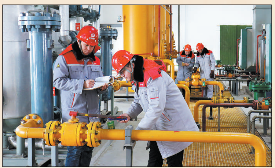
基础设施补短板，增强安全保障。吉林省白山市，燃气公司员工开展燃气管道隐患排查、检修。