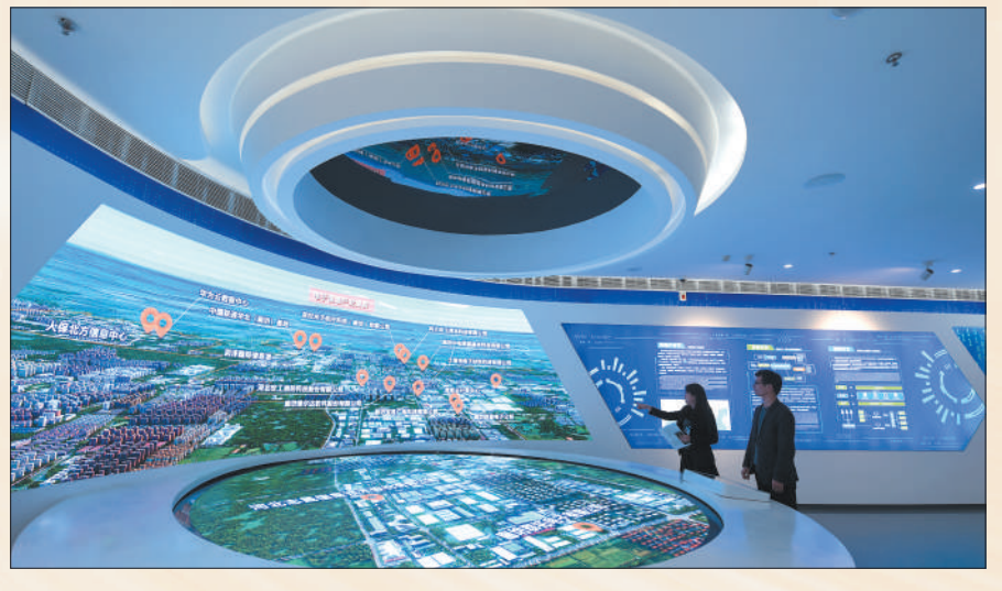
城市治理更智慧，赋能美好生活。河北省廊坊开发区智慧城市运营中心，工作人员介绍开发区电子信息产业概况。