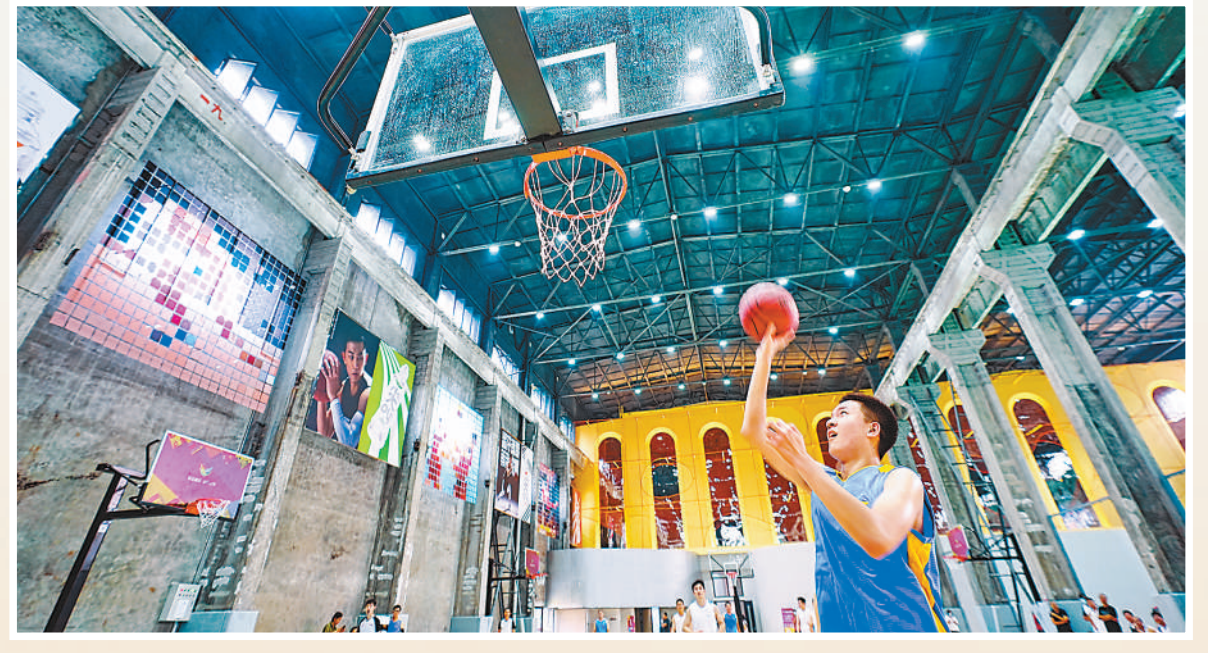
老厂房焕发新生机，带动产业升级。北京中关村丰台科技园将储煤用房改造为运动空间，助力全民健身，促进体育消费。