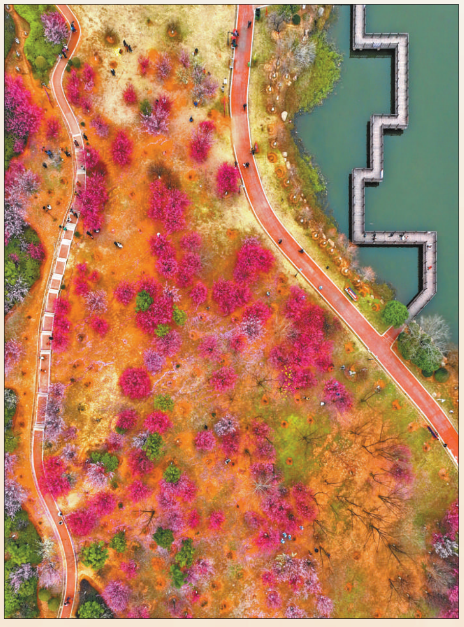
加强园林绿化建设，改善人居环境。江西省赣州经开区，市民到“口袋公园”赏花游玩。

人民城市人民建，人民城市为人民。以实施城市更新行动为抓手，着力打造宜居、韧性、智慧城市，群众的生活将更方便、更舒心、更美好。