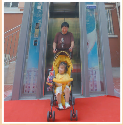
左图：完善配套设施，满足群众需要。山东省青岛市李沧区浮山路街道福林苑小区，居民乘坐加装后的电梯出行。