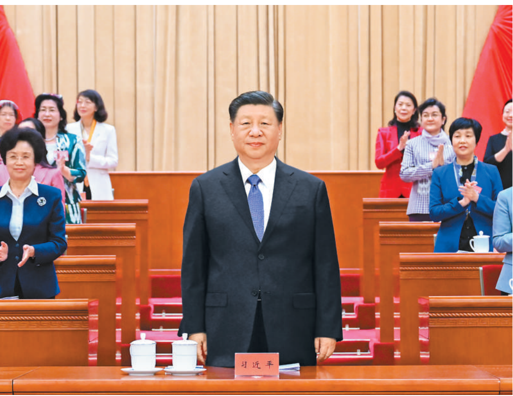
10月23日,中国妇女第十三次全国代表大会在北京人民大会堂开幕。这是中共中央总书记、国家主席、中央军委主席习近平在主席台向与会代表致意。新华社记者 谢环驰摄