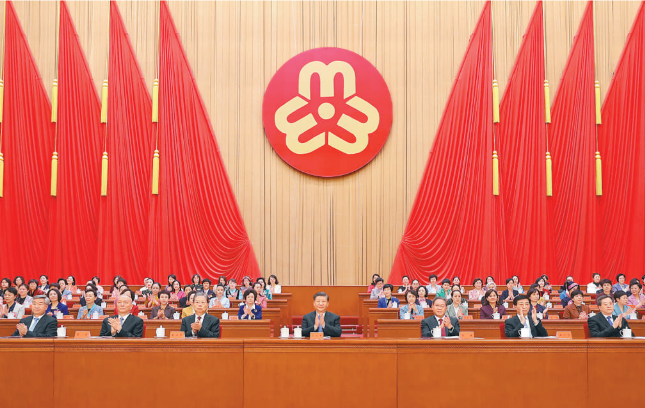
10月23日,中国妇女第十三次全国代表大会在北京人民大会堂开幕。习近平、李强、赵乐际、王沪宁、蔡奇、丁薛祥、李希等在主席台就座,祝贺大会召开。

本报北京10月23日电 (记者李昌禹)中国妇女第十三次全国代表大会23日上午在人民大会堂开幕。习近平、李强、赵乐际、王沪宁、蔡奇、李希等党和国家领导人到会祝贺,丁薛祥代表党中央致词。 人民大会堂大礼堂气氛庄重热烈。主席台上悬挂着“中国妇女第十三次全国代表大会”会标,后幕正中是鲜艳的中华全国妇女联合会会徽,10面红旗分列两侧。二楼眺台悬挂着“以习近平新时代中国特色社会主义思想为指导,全面贯彻党的二十大精神,动员引领各族各界妇女为全面建设社会主义现代化国家、全面推进中华民族伟大复兴而团结奋斗!”巨型横幅。 近1800名来自全国各行各业的中国妇女十三大代表和90名来自香港特别行政区、澳门特别行政区的特邀代