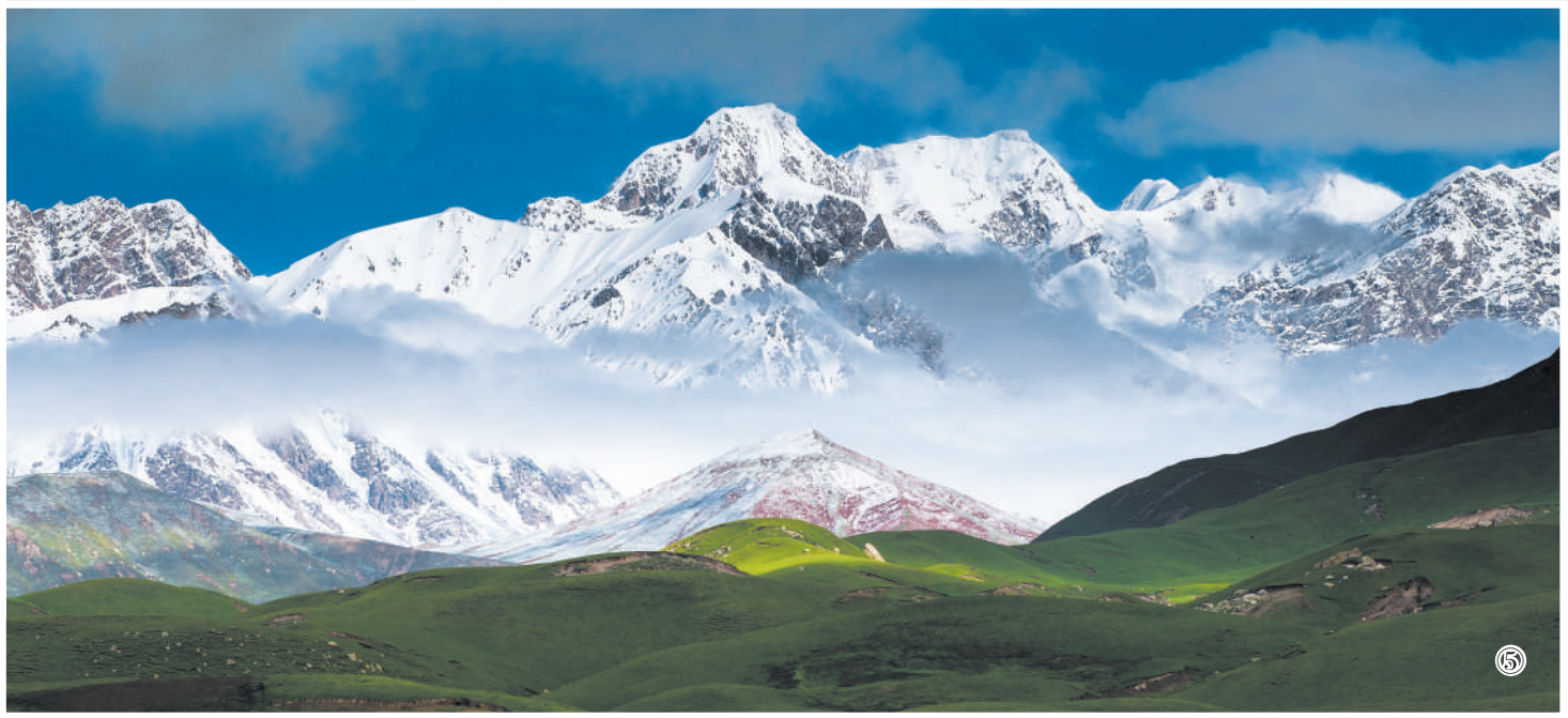
图⑤：天山南北以特有的自然风光吸引各地游客。图为南天山山麓。