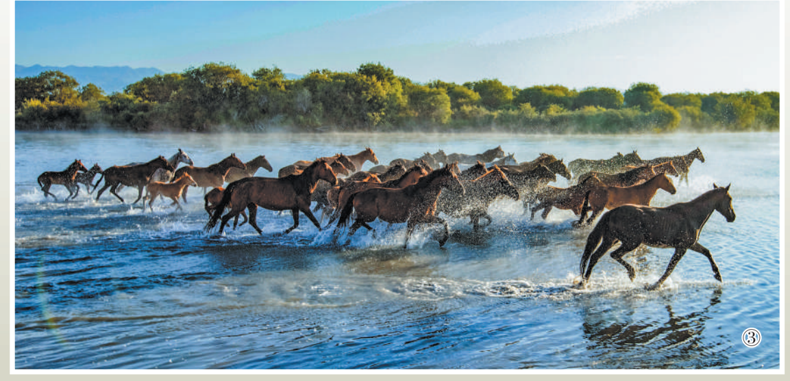
图③：昭苏县素有“天马之乡”的美誉。盛夏时节，昭苏湿地公园水草丰盛，骏马在河流中飞奔，呈现出天马浴河的震撼场面。