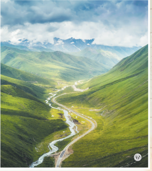
图⑥：独库公路蜿蜒在天山山脉草原山谷中。