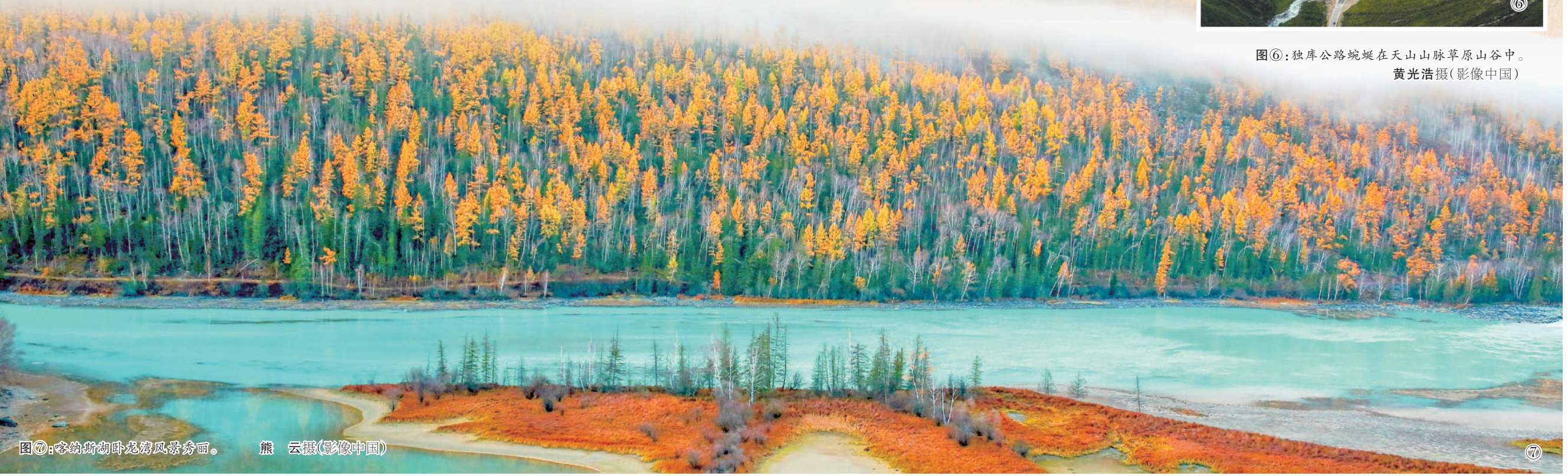
图⑦：喀纳斯湖畔龙湾风景秀丽。熊云摄（影像中国）