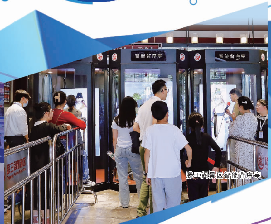
滕王阁景区智能排队亭