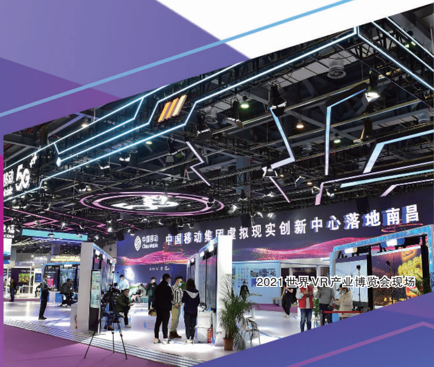
2021世界VR产业博览会现场