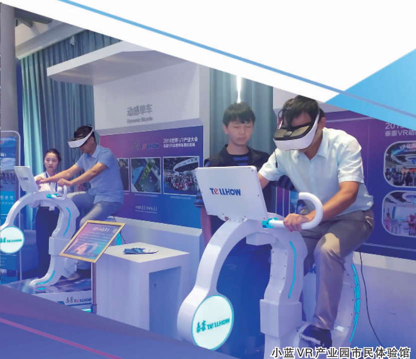
小蓝VR产业园市民体验馆