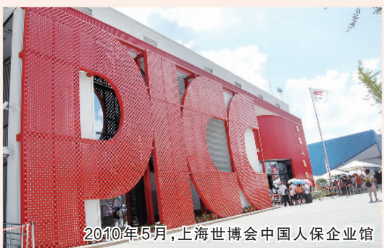
2010年5月,上海世博会中国人保企业馆

面向未来,中国人保将坚定不移走好中国特色金融发展之路,务实推进卓越战略实施,更加突出服务国家战略,更加突出发展质量、创新驱动和全面风险管理,以高质量发展服务中国式现代化。