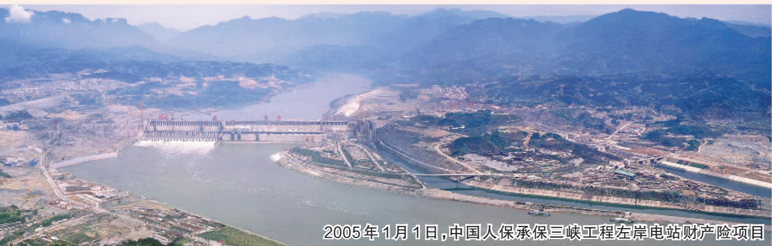
2005年1月1日,中国人保承保三峡工程左岸电站财产险项目