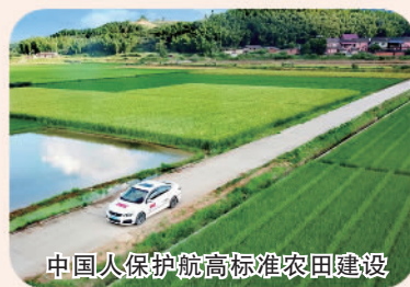
中国人保护航高标准农田建设

中国人保落地种业行动计划,提高粮食和重要农产品保险保障水平,全力服务国家粮食安全;持续提升帮扶力度,大力实施消费帮扶,着力打造乡村人才队伍,全力巩固拓展脱贫攻坚成果;助力农业基础设施建设,构建现代农业产业体系,提升农业防灾减损能力,全力保障农业现代化建设,进一步推进乡村振兴各项工作任务落地。2022年,不断完善“乡村保”项目产品体系,共为1.8亿户次农户提供47.9万亿元的风险保障。