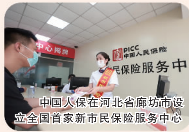
中国人保在河北省廊坊市设立全国首家新市民保险服务中心

中国人保积极参与城乡居民大病保险、医疗救助、长期护理保险、门诊慢特病经办管理和服务,持续扩大“惠民保”项目覆盖面,积极参与新业态人员职业伤害保险试点,让人民群众享有更高效便捷的医保服务。2022年,共承办社保项目近1800个,覆盖31个省(自治区、直辖市),服务近11亿人次;承办“惠民保”项目136个,覆盖超200个城市,承保超8100万人次;创新推出“安业保”职业伤害系列保险,为货车司机、快递员等近10万人提供风险保障超过500亿元。