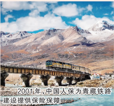
2001年,中国人保为青藏铁路建设提供保险保障