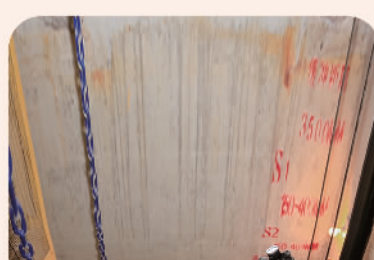
中国人保通过“保险+服务+科技”模式为天津市滨海新区28台电梯提供风险管理服务

中国人保积极发挥社会“稳定器”功能,以场景化为出发点,针对各类风险场景,研发风险管理技术模型。打造全面风险管理运作平台,丰富巨灾保险产品供给,及时响应重大灾害理赔救援,参与灾害风险管理。提供城市治理一揽子解决方案,服务保障人民生活安定,助力提升全社会风险防范和治理水平。截至2022年底,累计为客户发送气象预警报告4万余期;巨灾保险产品拓展至13个省份、61个地市,覆盖人口2.4亿人。