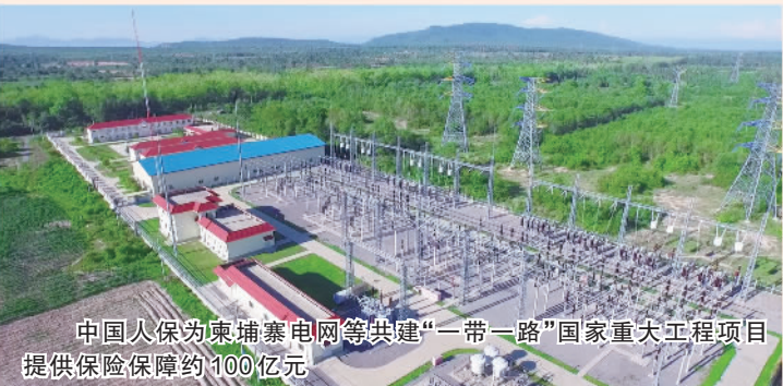
中国人保为柬埔寨电网等共建“一带一路”国家重大工程项目提供保险保障约100亿元