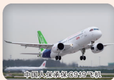
中国人保承保C919飞机

中国人保坚持服务科技强国战略,服务国家重大项目建设,助力国家关键核心技术发展,全力保障国家战略科技力量;丰富科技保险产品供给,提升产业保险保障水平,完善知识产权保障体系,全力推动科技保险扩面升级;积极融入“科技—产业—金融”良性循环,持续优化科技金融服务,倾力保障核心技术和实体经济发展,为实现高水平科技自立自强提供有力支撑。2022年,科技保险为企业提供3225.12亿元风险保障。同时,中国人保牵头组建中国集成电路共保体,2022年累计为17家集成电路重点客户提供风险保障超过1万亿元。