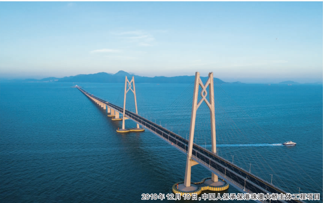
2010年12月10日,中国人保承保港珠澳大桥主体工程项目