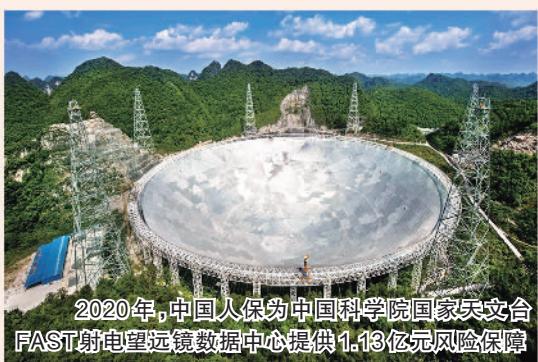
2020年,中国人保为中国科学院国家天文台FAST射电望远镜数据中心提供1.13亿元风险保障