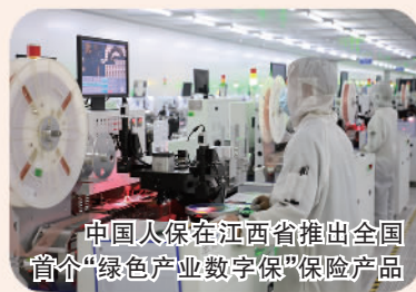
中国人保在江西省推出全国首个“绿色产业数字保”保险产品

中国人保积极开发支持制造业高质量发展的特色保险产品,积极构建支持数字经济的保险体系,聚焦产业痛点难点,持续发展完善产业园区保险。2022年,组建500余支产业园区保险专属服务团队,搭建园区保险营销管理、智慧园区风控服务两个专属平台,推出化工、科创、物流三套产业园区综合保险方案,累计服务全国2.3万个园区共14.9万家企业,提供风险保障74万亿元。