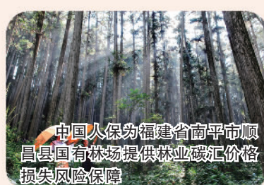
中国人保为福建省南平市顺昌县国有林场提供林业碳汇价格损失风险保障

中国人保努力践行绿色发展理念,优化升级“双碳”服务体系,扩大清洁能源保障范围,扩大环境责任保险覆盖范围,提升清洁能源承保能力,创新碳汇保险产品,保障降碳减排技术,助力碳市场发展,助推建筑业绿色低碳转型,为能源转型、减污降碳等重点领域提供保险解决方案,助力“双碳”目标实现。2022年,绿色保险产品共提供风险保障金额68万亿元。