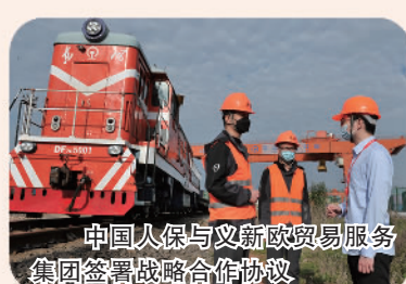
中国人保与义新欧贸易服务集团签署战略合作协议

中国人保积极发挥保险保障功能,服务共建“一带一路”国家基础设施建设。截至2022年底,承保越南金瓯潮间带风电、秘鲁圣加旺水电站、巴基斯坦胡布火电等380个“一带一路”项目。中国人保扎实推进“一带一路”保险网络搭建,延伸海外服务触角,推动中国东盟跨境再保险共同体正式成立,人保再保险成功获批智利保险监管注册。