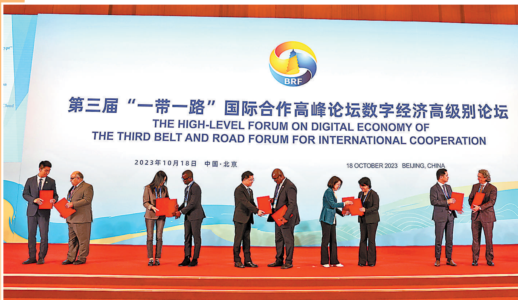
▲第三届“一带一路”国际合作高峰论坛数字经济高级别论坛企业文本交换仪式。