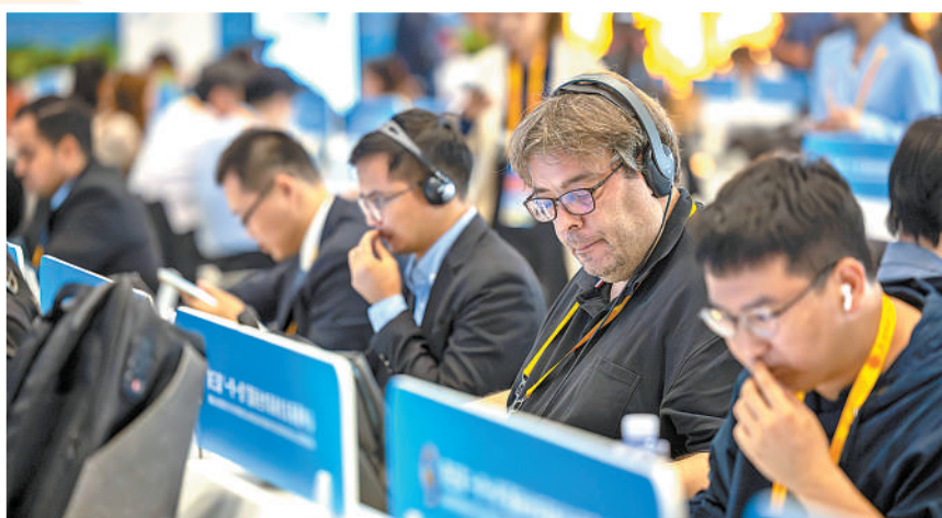
▲中外记者在第三届“一带一路”国际合作高峰论坛新闻中心工作。