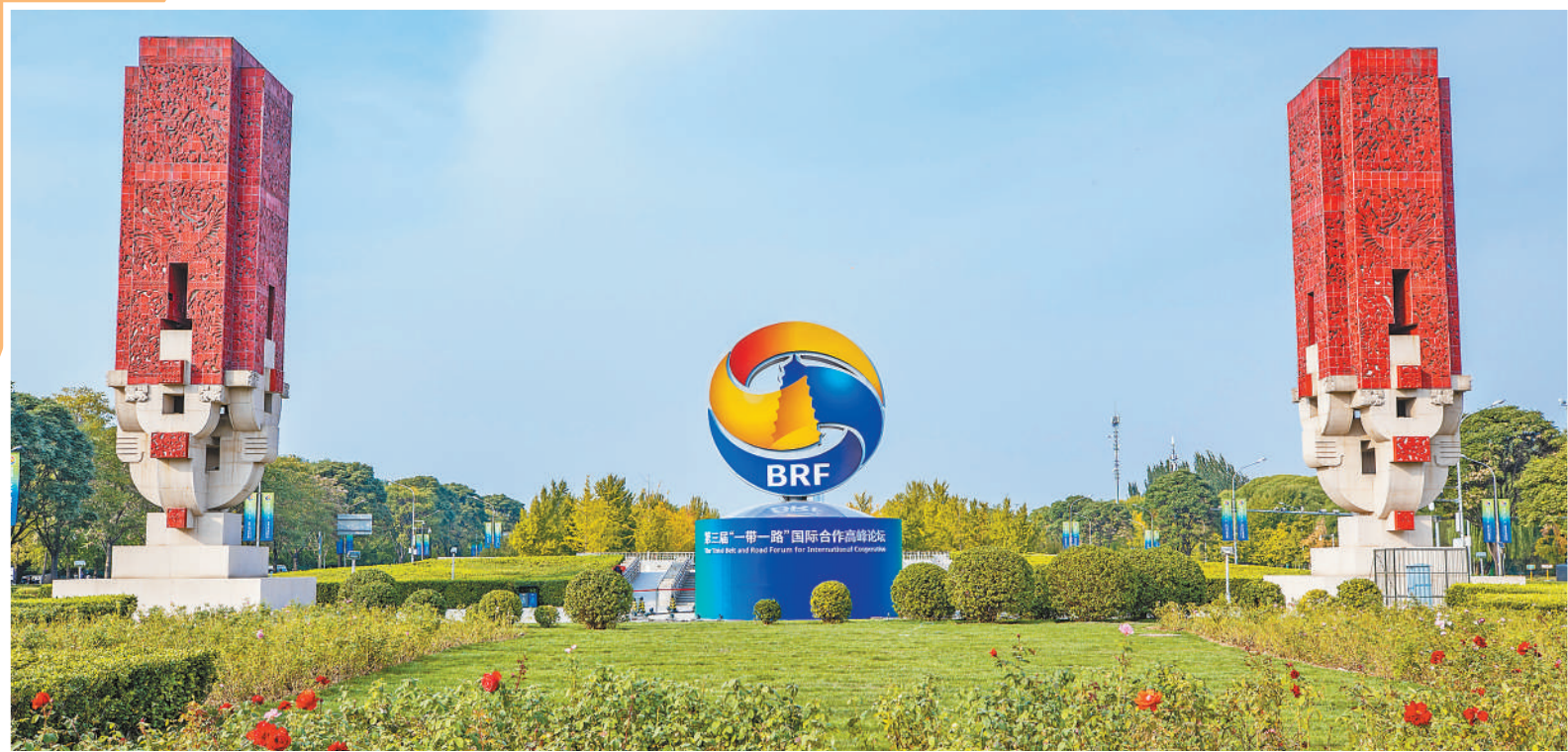
▲第三届“一带一路”国际合作高峰论坛景观布置。