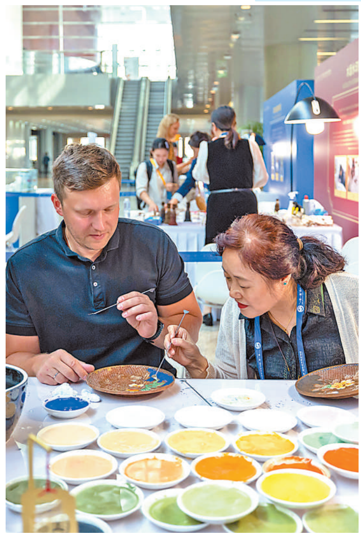
▲参加第三届“一带一路”国际合作高峰论坛的嘉宾体验景泰蓝制作。