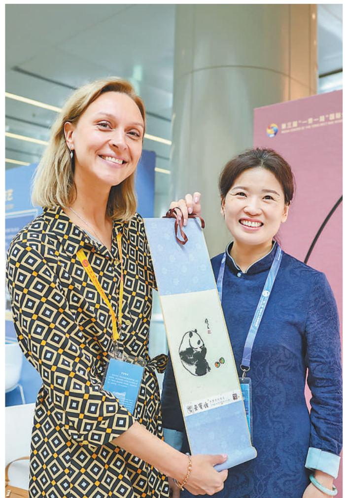
▲参加第三届“一带一路”国际合作高峰论坛的嘉宾体验木版水印技艺。

与会人士围绕多个主题进行深入交流,达成了一系列重要共识和丰硕成果。各方一致认为,本次高峰论坛是共建“一带一路”进程中又一个重要里程碑。这是一次团结的大会、共赢的大会、发展的大会,拓展了共建“一带一路”的光明前景。