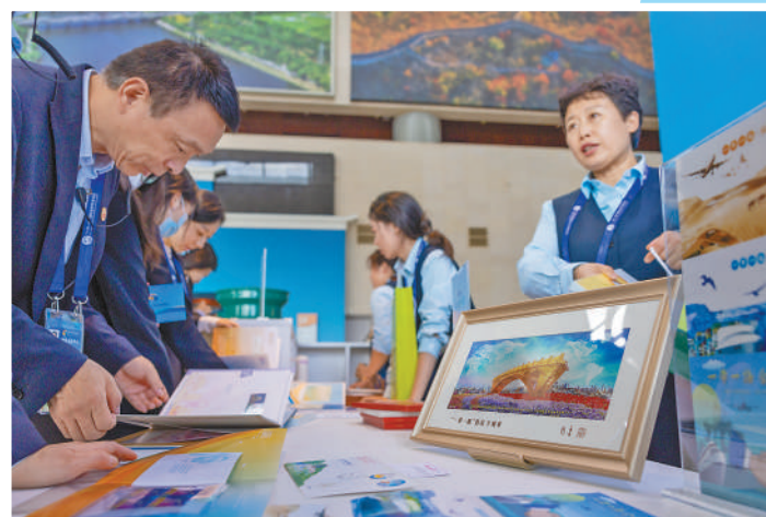
▲参加第三届“一带一路”国际合作高峰论坛的嘉宾挑选中国邮政推出的邮票、银版画等纪念品。