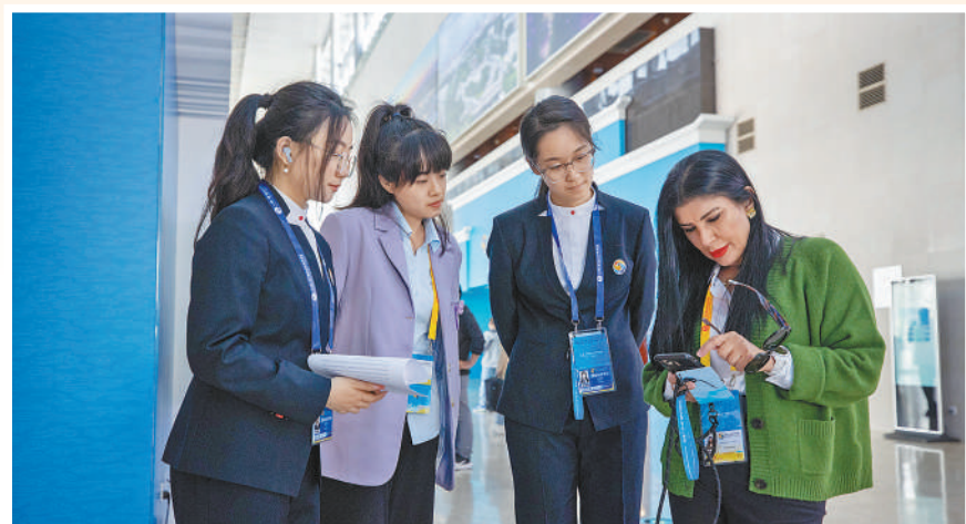
▲第三届“一带一路”国际合作高峰论坛新闻中心内,工作人员和志愿者为外国记者答疑。