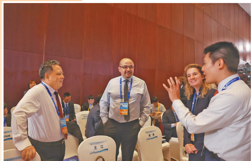
▲第三届“一带一路”国际合作高峰论坛中,与会人士在交谈。