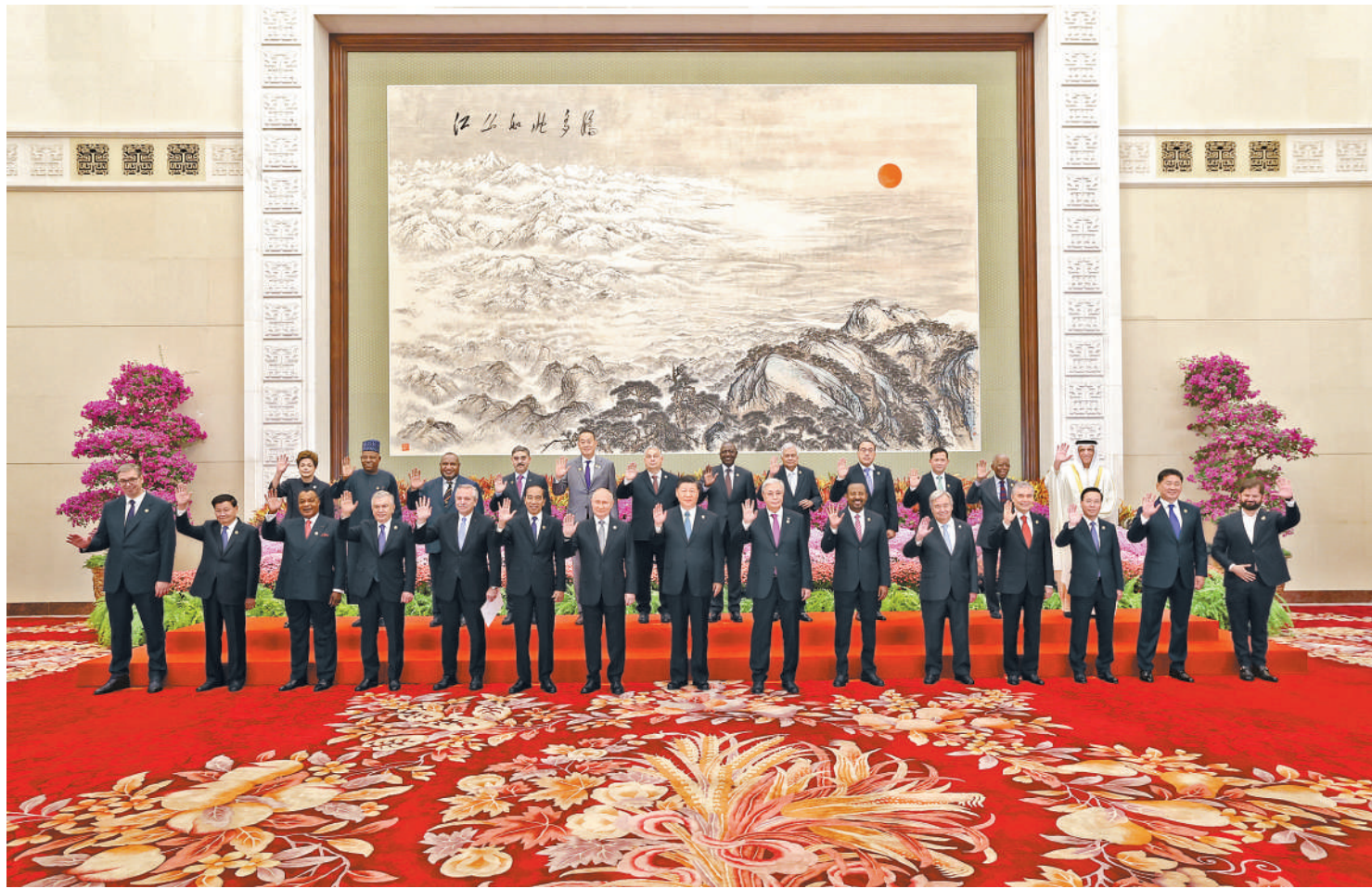
10月18日上午,国家主席习近平在北京人民大会堂出席第三届“一带一路”国际合作高峰论坛开幕式并发表题为《建设开放包容、互联互通、共同发展的世界》的主旨演讲。这是会前,习近平同出席高峰论坛的外国国家元首、政府首脑和国际组织负责人等国际贵宾集体合影。