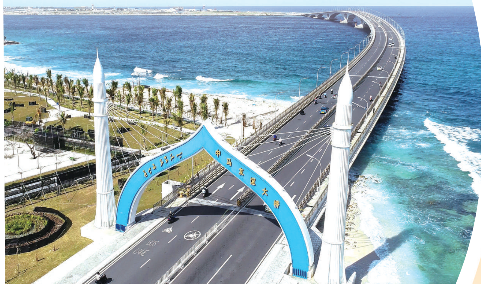
▲连接马尔代夫首都马累和机场岛的中马友谊大桥。