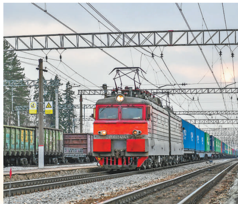
▲京平综合物流枢纽中欧班列(北京—莫斯科)抵达俄罗斯莫斯科州列雷斯特火车站。