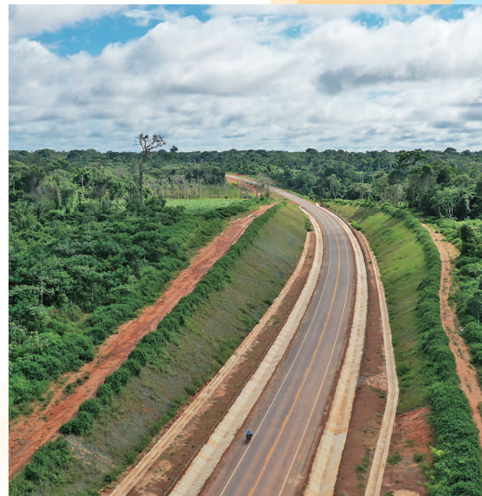
▲玻利维亚鲁雷纳瓦克至里韦拉尔塔公路。