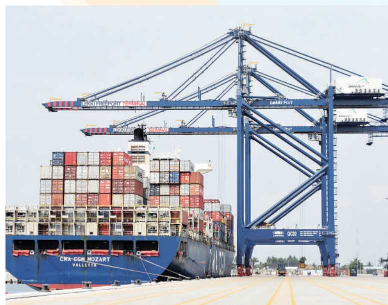
▲在尼日利亚拉各斯,一艘满载集装箱的货轮停泊在莱基深水港。