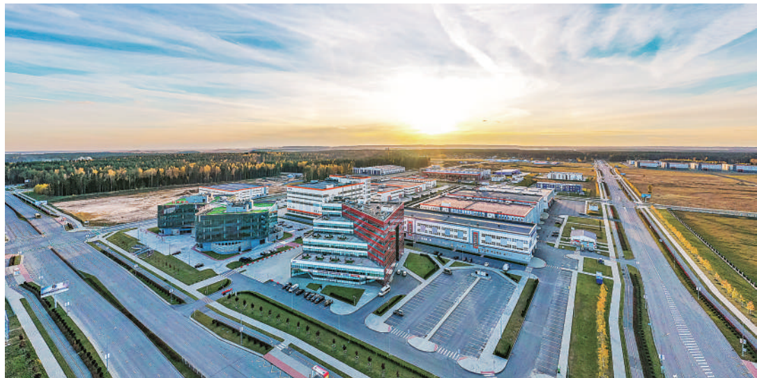
▲位于白俄罗斯首都明斯克郊区的中白工业园。