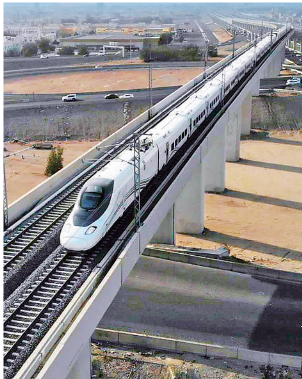
▲沙特麦麦(麦加—麦地那)高铁。