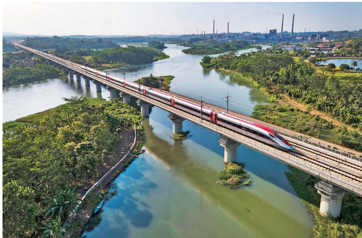
▲印度尼西亚雅万(雅加达—万隆)高铁。