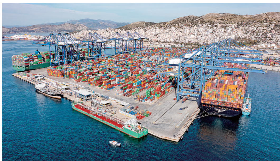
▲希腊比雷埃夫斯港集装箱3号码头。