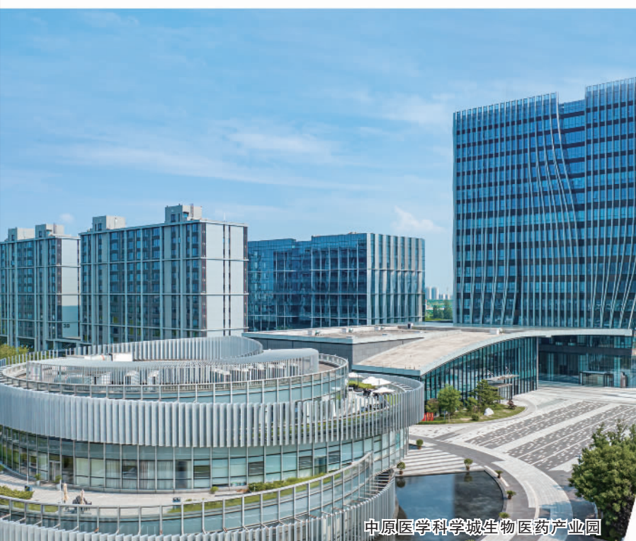
中原医学科学城生物医药产业园