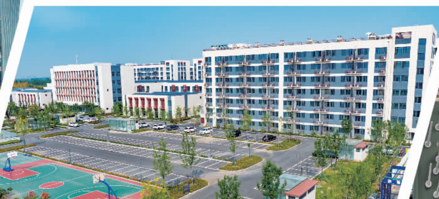
中原医学科学城人才公寓