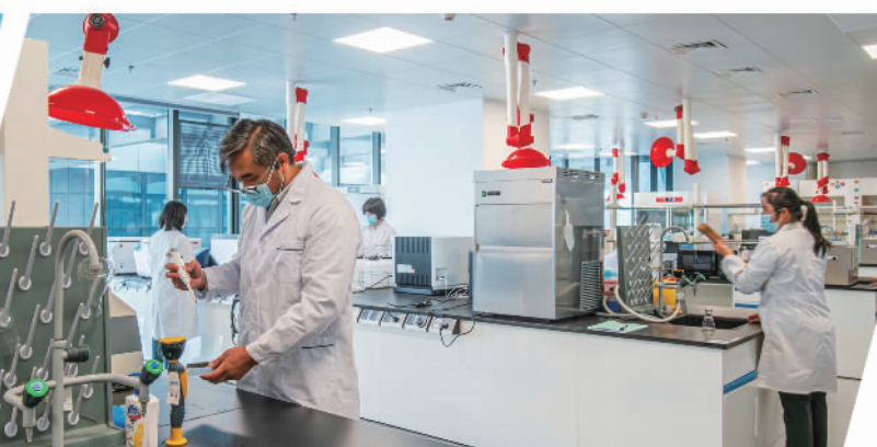
河南省医学科学院眼科研究所