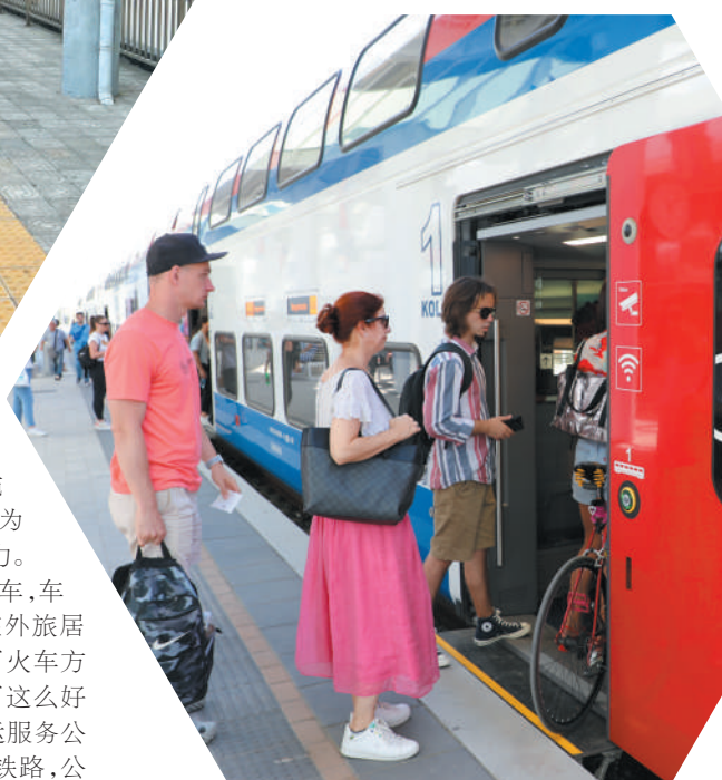
▲9月12日,在塞尔维亚诺维萨德火车站,乘客准备登上列车,经匈塞铁路前往其他城市。