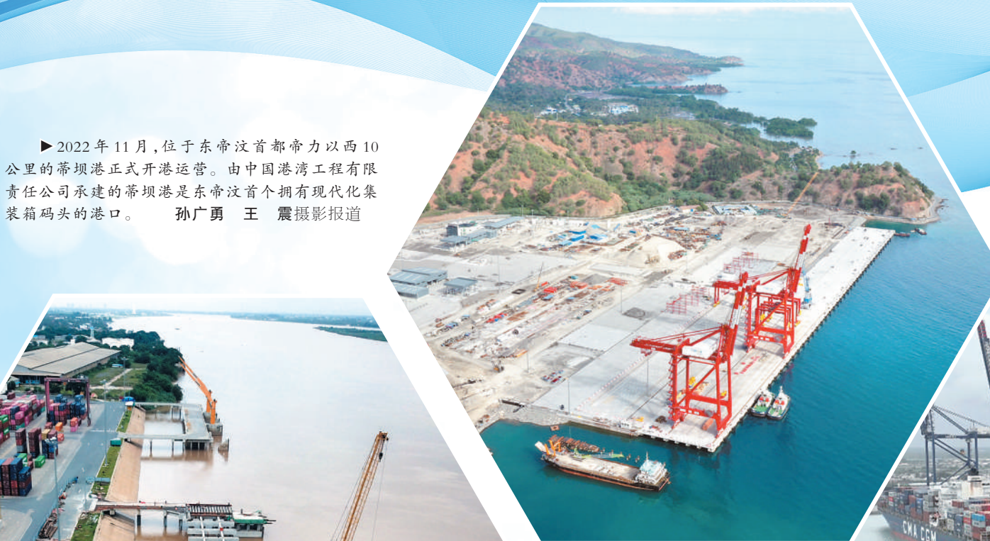
▶2022年11月,位于东帝汶首都帝力以西10公里的蒂坝港正式开港运营。由中国港湾工程有限责任公司承建的蒂坝港是东帝汶首个拥有现代化集装箱码头的港口。