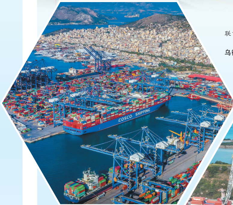
▶安提瓜和巴布达圣约翰深水港鸟瞰图。谢佳宁 鲁孟昊摄影报道