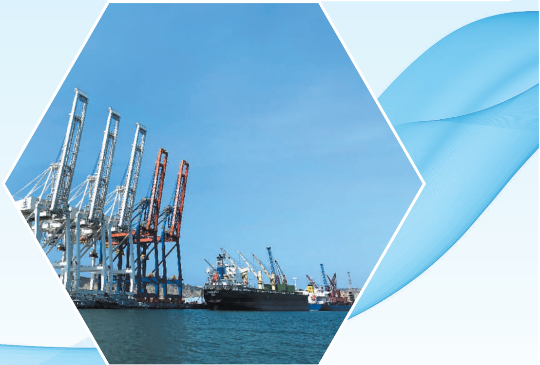
▼两艘大型货轮停靠在尼日利亚莱基深水港进行装卸作业。