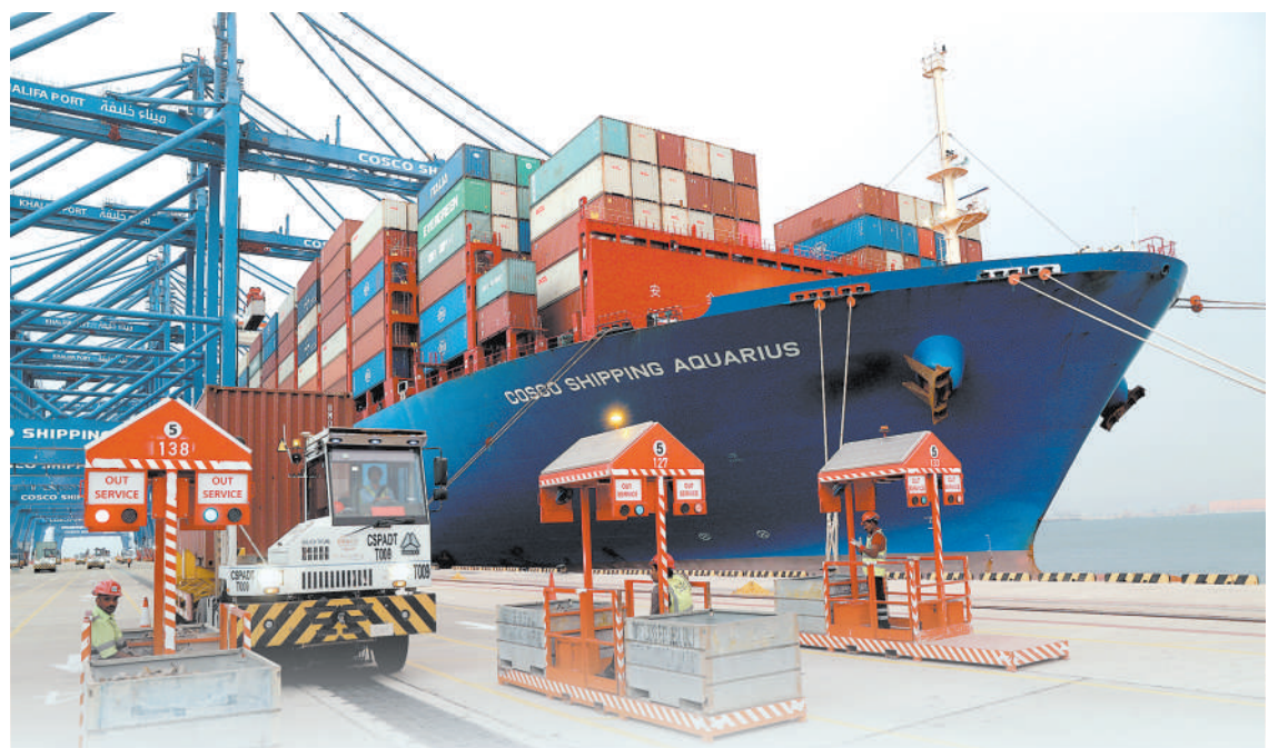
▲大型集装箱货轮停靠中远海运港口阿联酋阿布扎比码头。