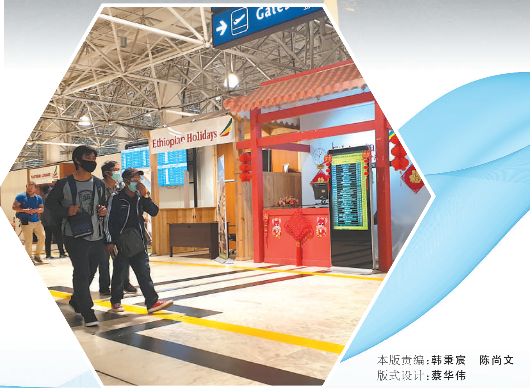
本版责编:韩秉宸 陈尚文 版式设计:蔡华伟