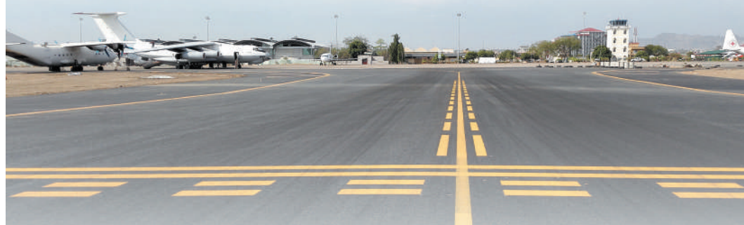
▼中企承建的新加坡朱巴国际机场改扩建项目。