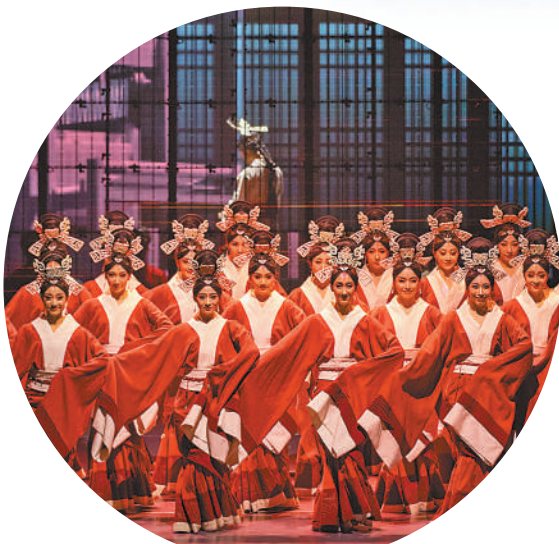
舞剧《五星出东方》剧照。