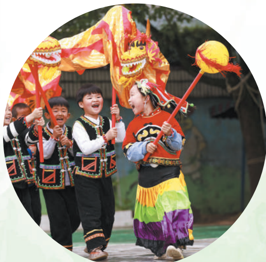
贵州省黔西市钟山镇中心幼儿园的孩子们在学习舞龙。