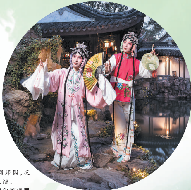
江苏省苏州市网师园,夜游项目《游园惊梦》上演。