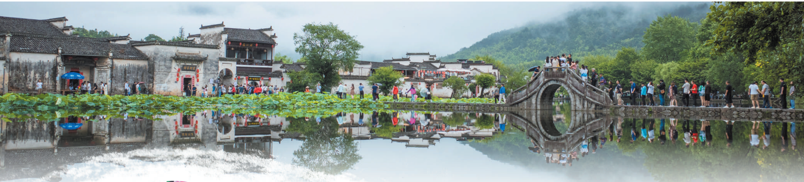
安徽省黄山市宏村景区游人如织。