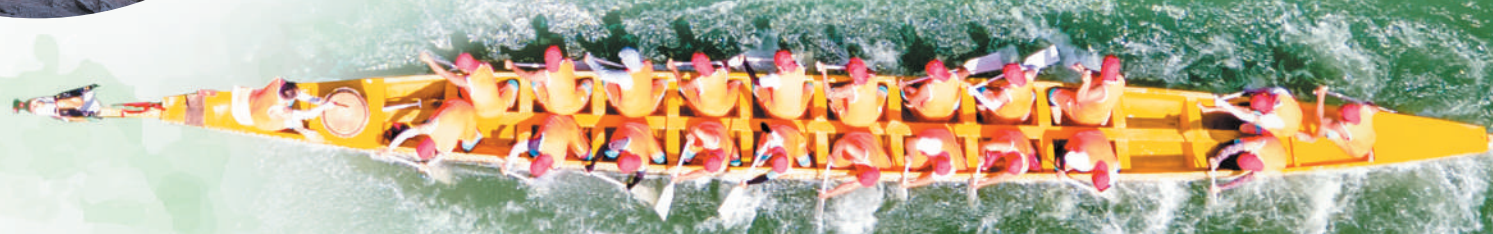
一年一度的龙舟大赛在海向球游博暨万泉河入海口举行。