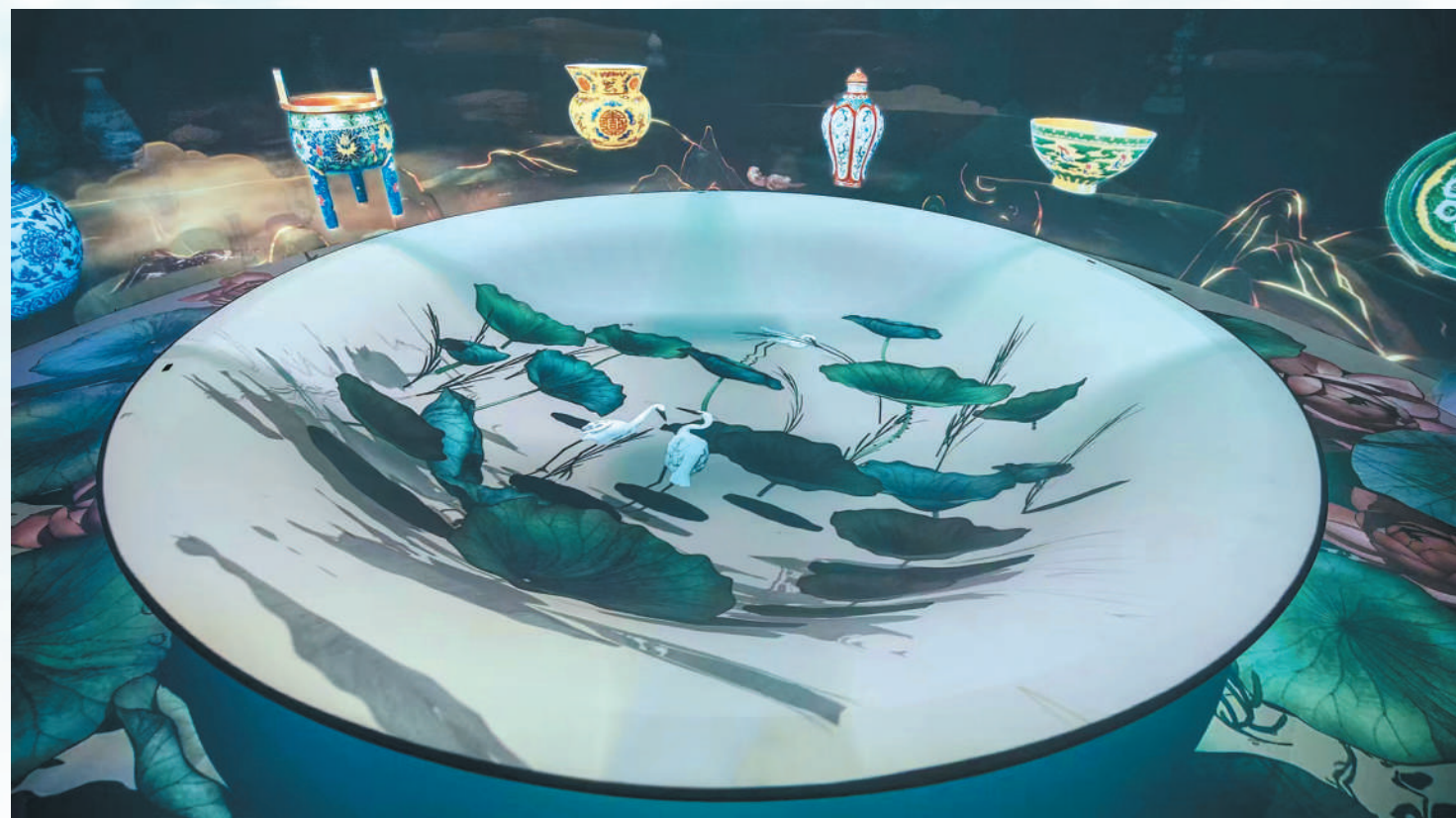
“纹”以载道——故宫腾讯沉浸式数字体验展。