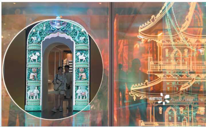
江苏南京城墙博物馆内，观众在参观“文谋武烈——永乐的世界遗产”特展。