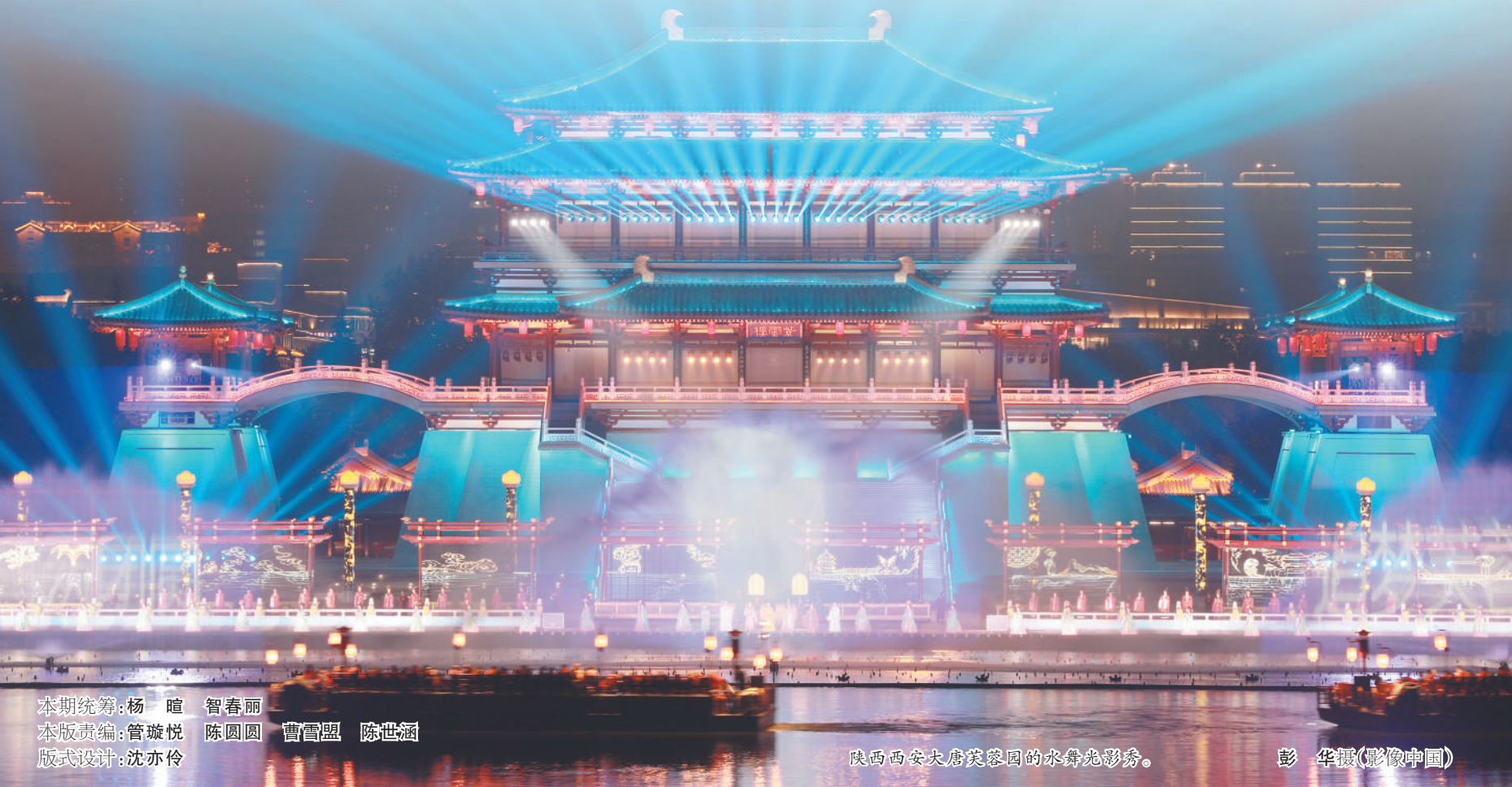
陕西西安大唐芙蓉园的水舞光影秀。