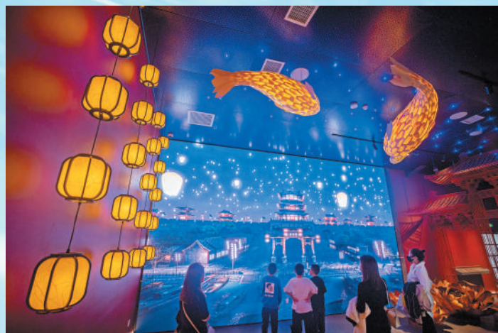
游客在山西省运城市河东历史文化展示中心参观游览。

习近平总书记在文化传承发展座谈会上强调：“中国文化源远流长，中华文明博大精深。只有全面深入了解中华文明的历史，才能更有效地推动中华优秀传统文化创造性转化、创新性发展，更有力地推进中国特色社会主义文化建设，建设中华民族现代文明。”党的二十大报告提出，“实施国家文化数字化战略”“加大文物和文化遗产保护力度”。