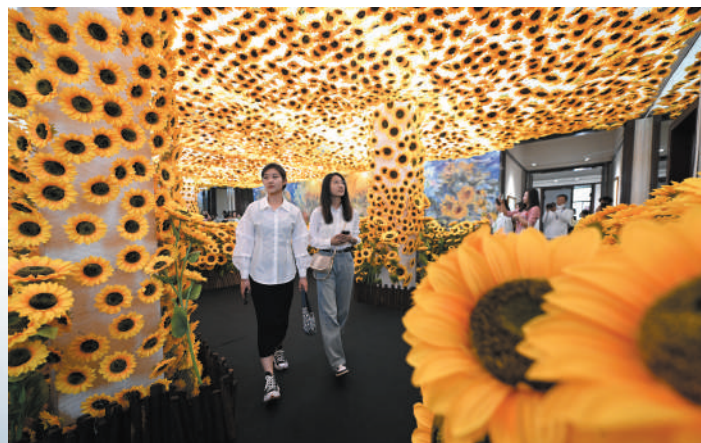
观众在天津数字艺术博物馆全景数字艺术互动大展预展上参观。