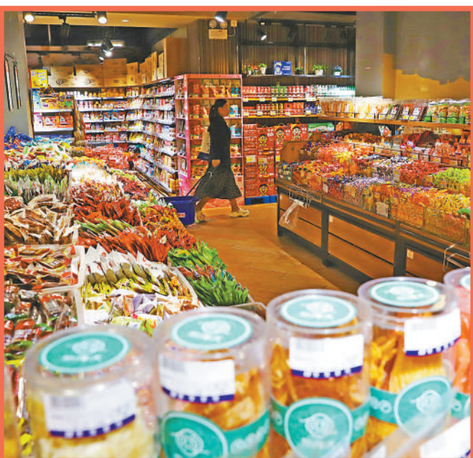
▲10月5日,河北省涿州市的一家超市内商品琳琅满目。