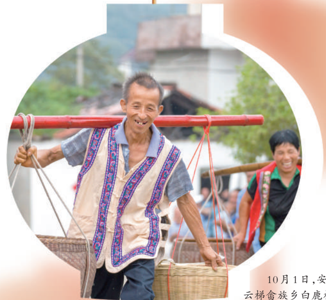
10月1日,安徽省宁国市云梯畲族乡白鹿村,村民将收获的农产品挑往集市售卖。