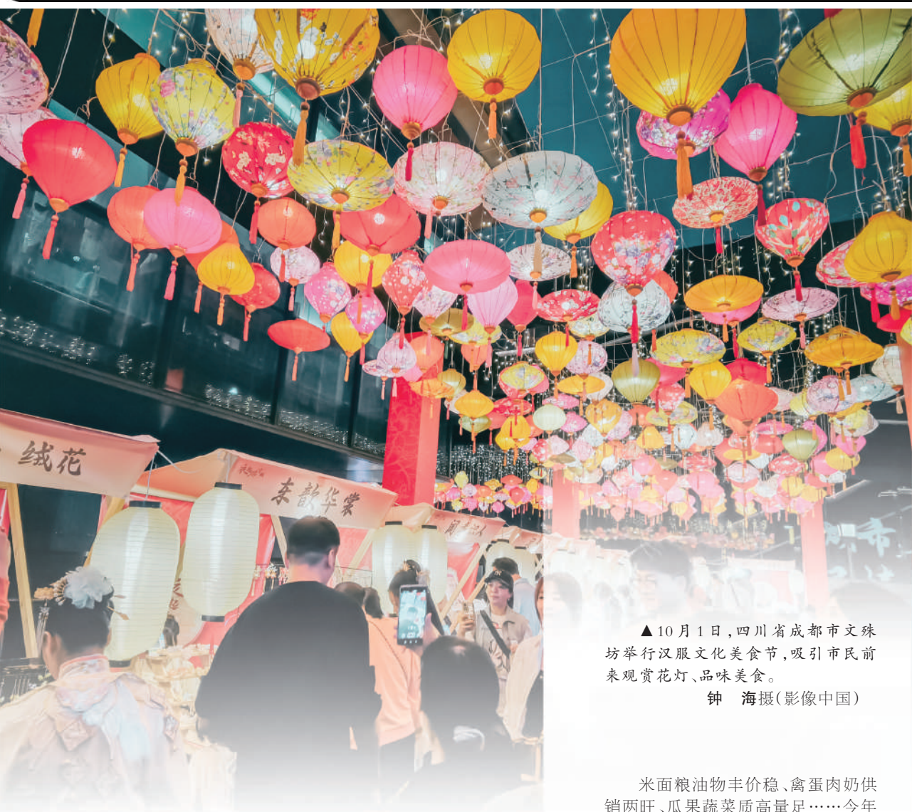
▲10月1日,四川省成都市文殊坊举行汉服文化美食节,吸引市民前来观赏花灯、品味美食。

米面粮油物丰价稳,禽蛋肉奶供销两旺,瓜果蔬菜质高量足……今年中秋国庆假期,各地市场商品供应充足、价格稳定,“米袋子”“菜篮子”“肉案子”“果盘子”“油瓶子”均保障有力,稳稳提升人民群众假期生活的获得感、幸福感、安全感。