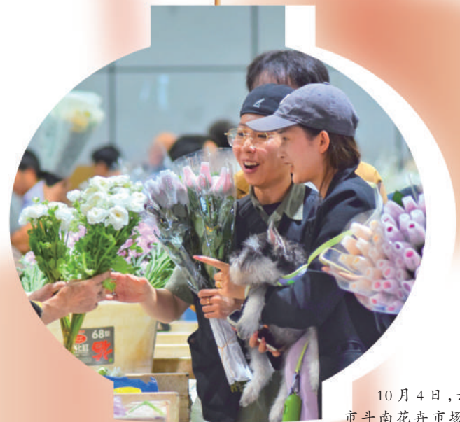
10月4日,云南省昆明市斗南花卉市场,群众在挑选鲜花。