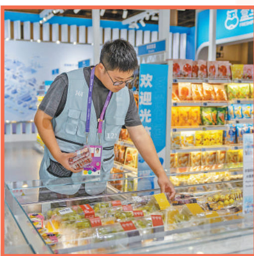
▲10月2日,杭州亚运会主媒体中心内的超市商品丰富。