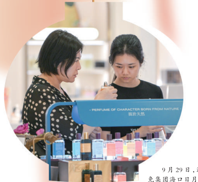
9月29日,消费者在中免集团海口日月广场免税店选购商品。