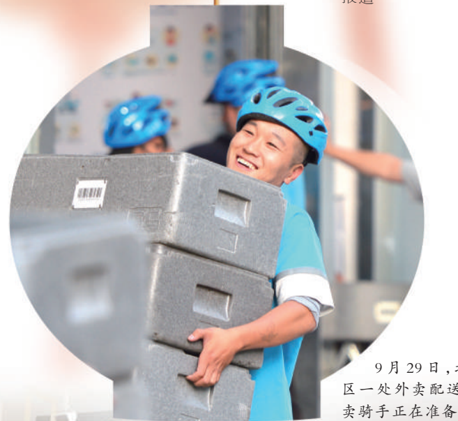
9月29日,北京市朝阳区一处外卖配送分点,外卖骑手正在准备配送。