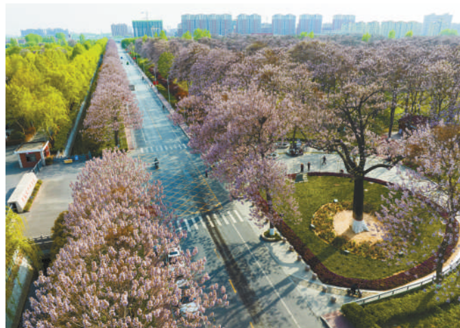
开封市兰考县,具有防风沙功能的泡桐树生机勃勃。