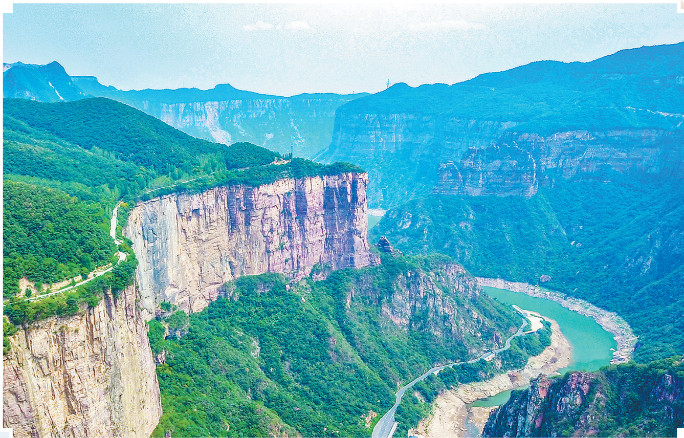
上图:辉县市薄壁镇太行山大峡谷郁郁葱葱。