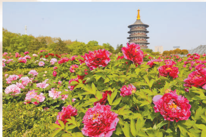
洛阳市隋唐洛阳城国家遗址公园内牡丹花绽放。