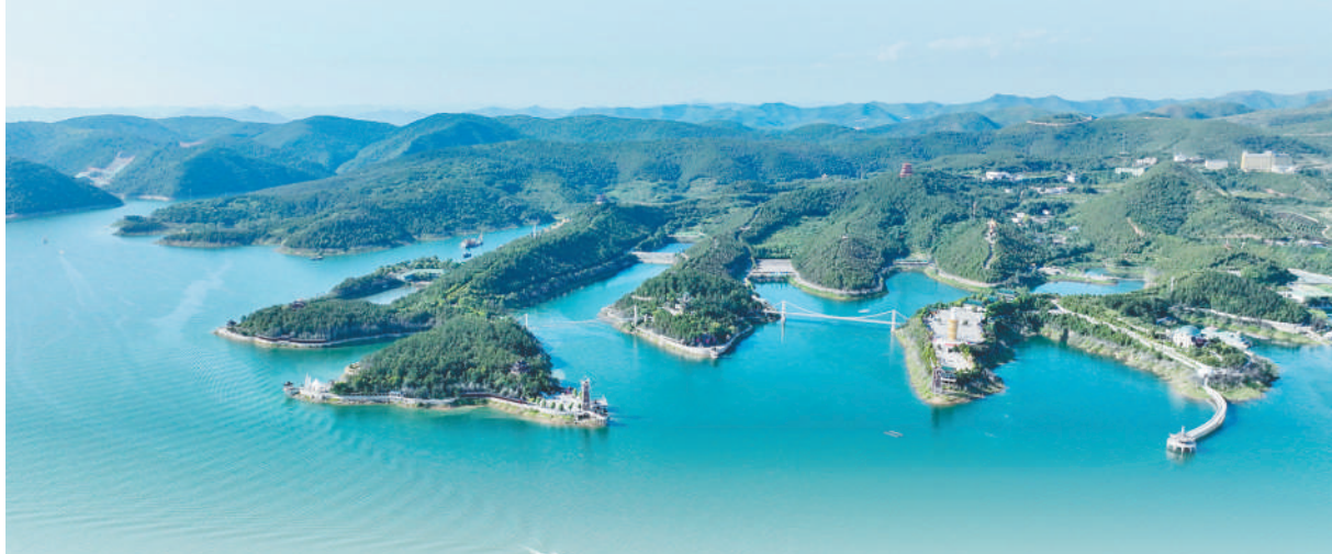
上图:南阳市淅川县,南水北调中线工程丹江口库区碧波荡漾,生机盎然。