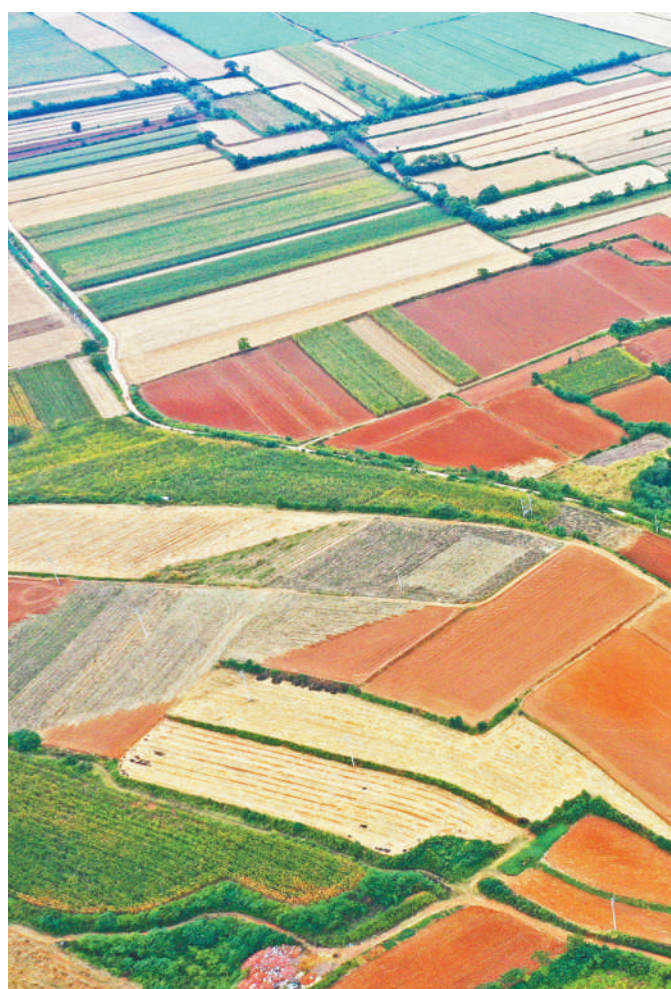
孟州市赵和镇,万亩良田阡陌纵横,色彩斑斓。