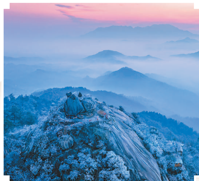
信阳市商城县,地处大别山腹地的石鼓山引人入胜。