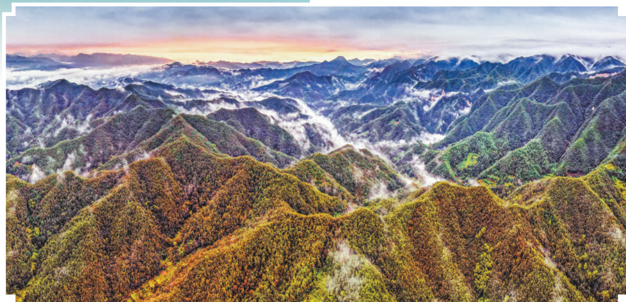
右图:栾川县,伏牛山巍峨壮丽。