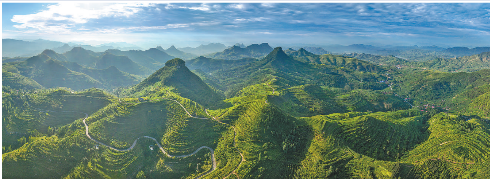
苍翠的沂蒙群山。