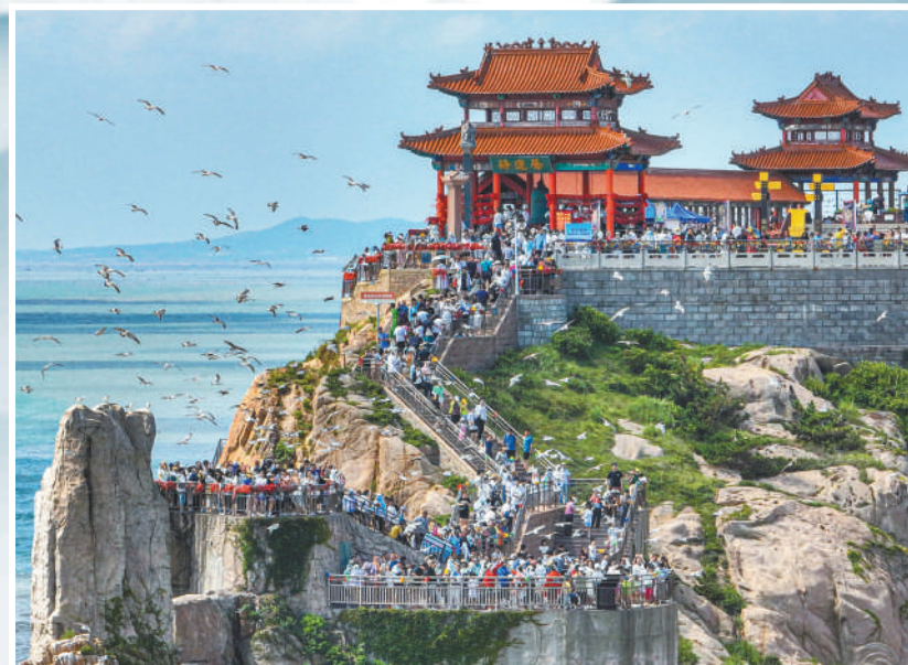
威海荣成,成山头风景区,游客观海听潮。