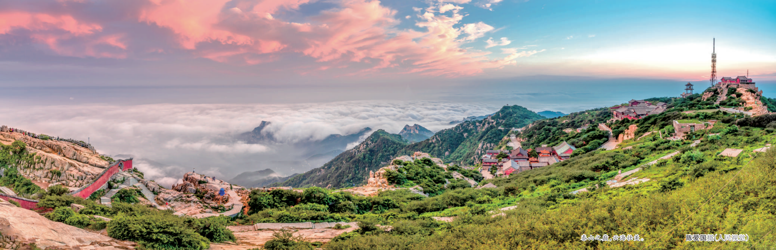
泰山之巅,云海壮观。