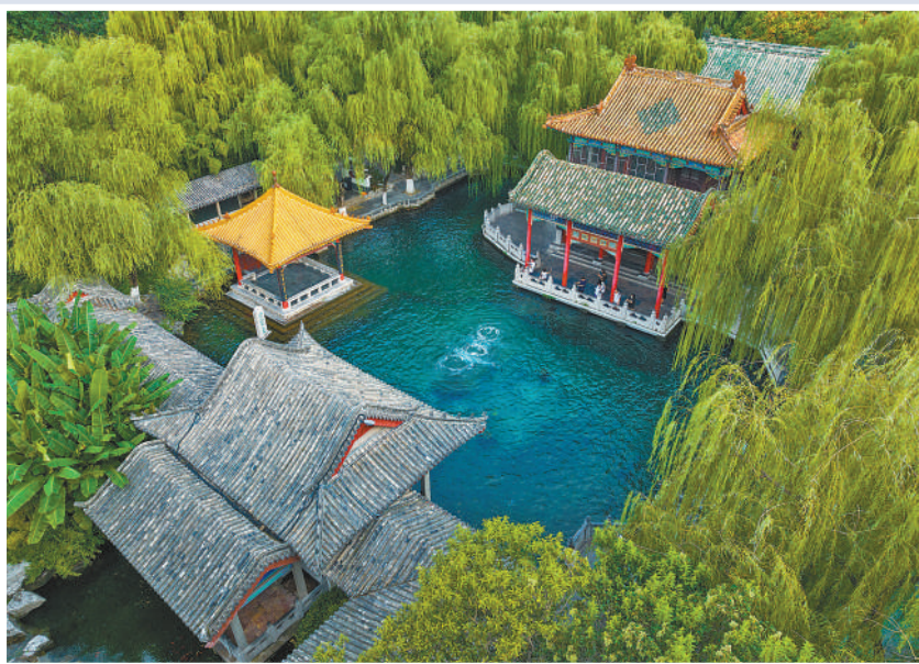
被誉为“天下第一泉”的济南趵突泉。