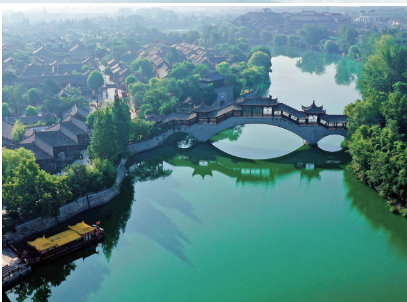
大运河国家文化公园(枣庄段)台儿庄古城景色。