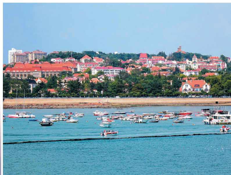
青岛海滨,红瓦绿树,碧海蓝天。