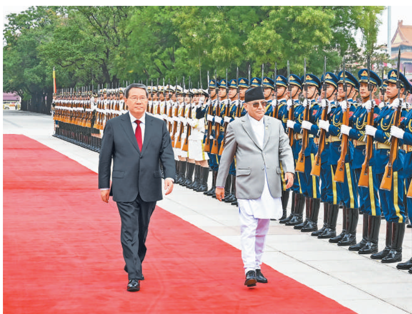
9月25日上午,国务院总理李强在北京人民大会堂同来华进行正式访问的尼泊尔总理普拉昌达举行会谈。这是会谈前,李强在人民大会堂东门外广场为普拉昌达举行欢迎仪式。

中国家共同利益。 巴沙尔祝贺中方成功举办杭州亚运会开幕式,感谢中方为支持叙经济社会发展、缓解人道主义危机和抗震救灾提供的宝贵帮助。巴沙尔表示,中国在国际事务中发挥着重要作用,叙中关系日益巩固,互信不断深化,叙方对中国建立战略伙伴关系深感自豪。叙方支持习近平主席提出的“一带一路”倡议和三大全球倡议,愿同中方一道落实上述倡议,进一步深化经济、人文等领域合作,维护双方共同利益。 吴政隆参加会见。