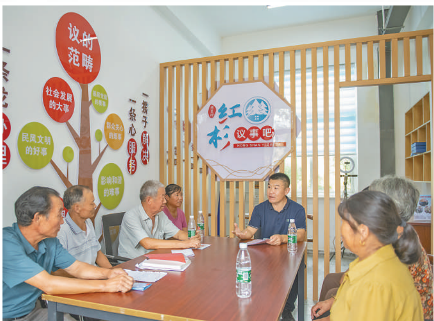
江苏宿迁市宿豫区大兴镇周夏村创建“红杉议事吧”，通过一站式接待、一条龙办理、一条心服务、一揽子解决模式，完善乡村治理。