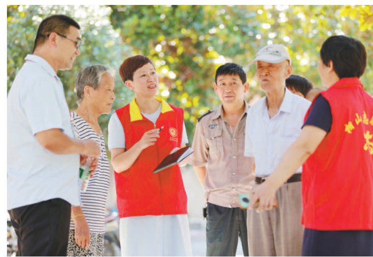
安徽淮北市相山区东山街道建国社区通过“村务会商”“邻里说事治理”等方式，实现矛盾纠纷和群众诉求“一站式”解决。图为社区志愿者与群众交流。