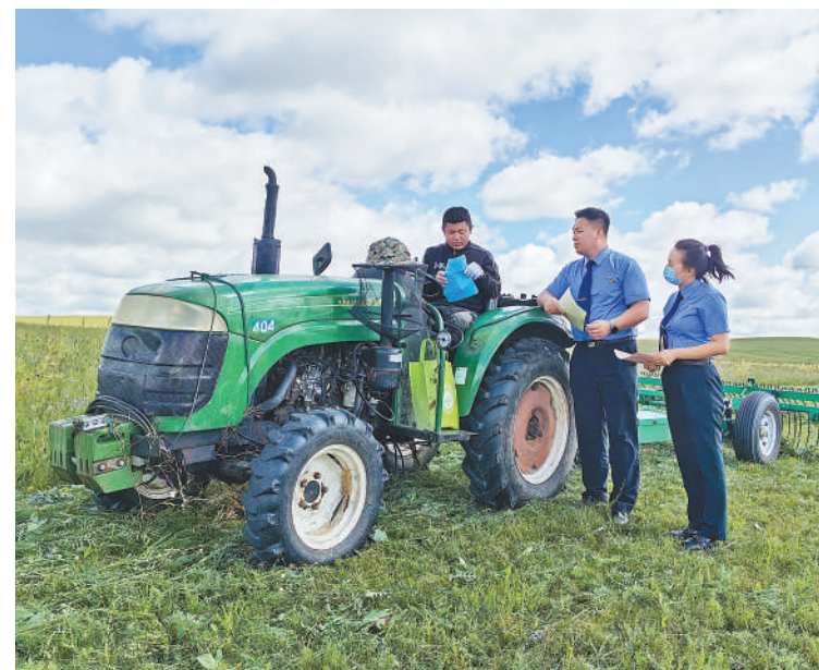
内蒙古锡林郭勒盟乌拉盖管理区检察院干警向牧民介绍与草原生态环境保护有关的法律知识。