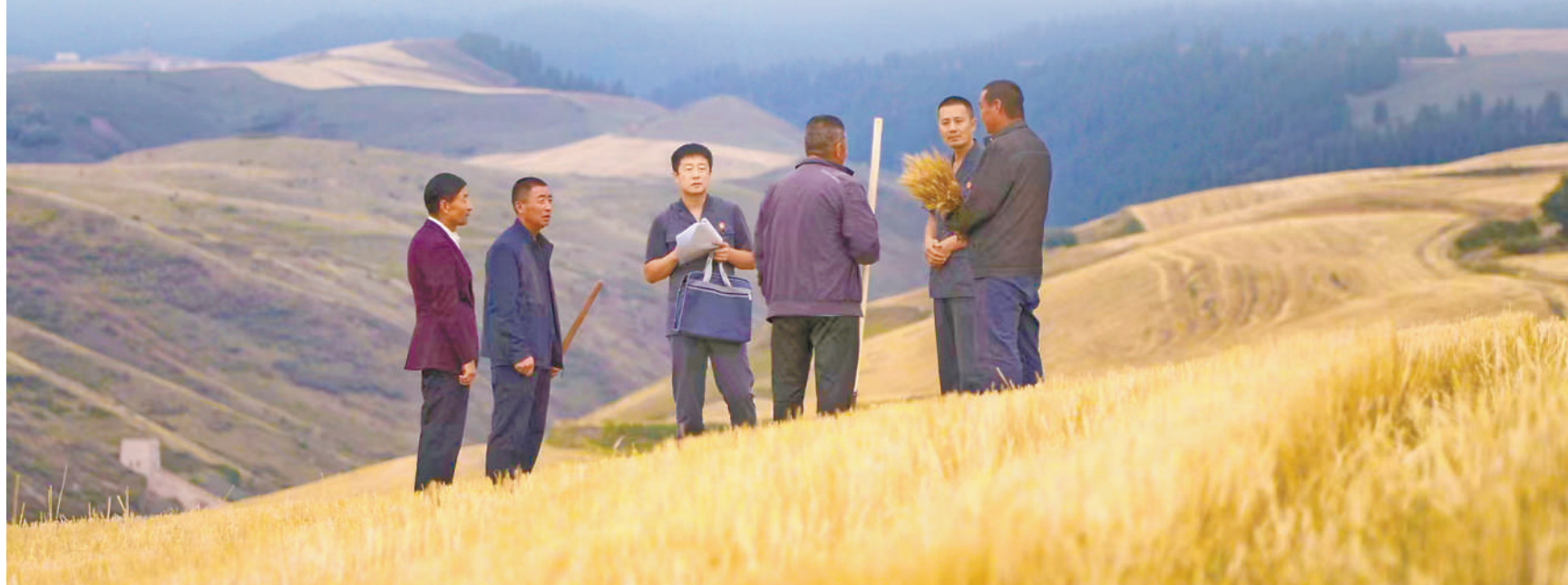
新疆昌吉回族自治州奇台县人民法院老奇台人民法庭干警开展调解工作。