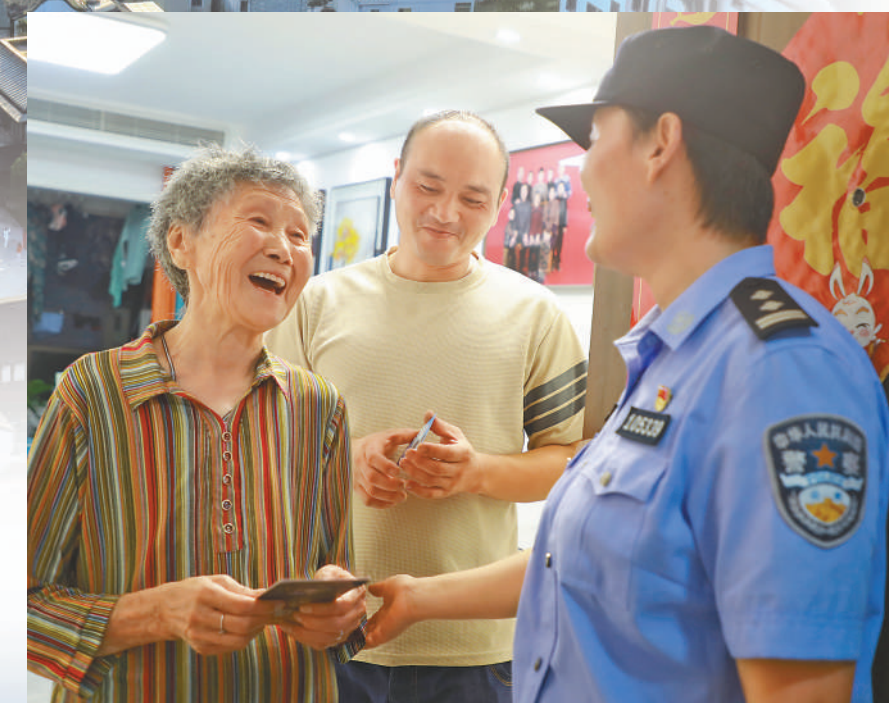
河南新郑市公安局龙湖派出所社区民警到辖区居民家中走访。