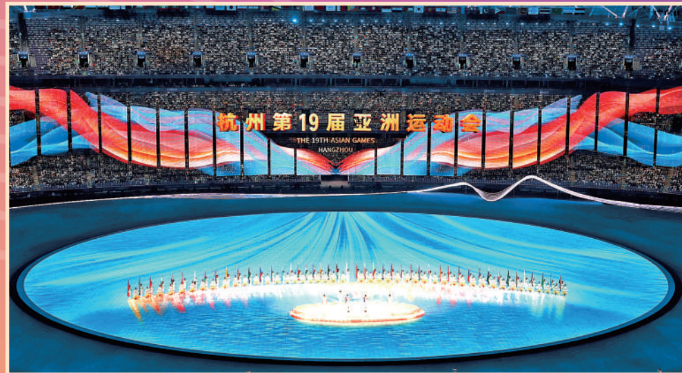
▲裁判员代表在开幕式上宣誓。