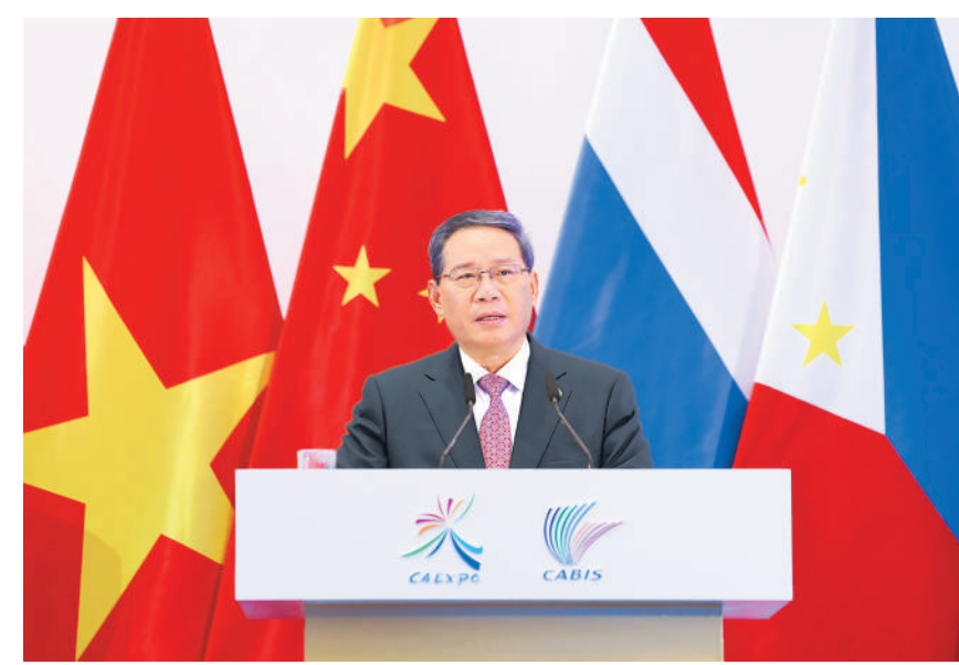
9月17日上午,国务院总理李强在广西南宁出席第二届中国—东盟博览会和中国—东盟商务与投资峰会开幕式并致辞。

本报南宁9月17日电(记者邓建胜、王迪、刘玲玲)国务院总理李强9月17日上午在广西南宁出席第二届中国—东盟博览会和中国—东盟商务与投资峰会开幕式并致辞。柬埔寨首相洪玛奈、老挝总理宋赛、马来西亚总理安瓦尔、越南总理范明政、印度尼西亚副总统马鲁夫、泰国副总理兼商业部长普坦、东盟秘书长高金洪,以及中国、东盟等国家和地区工商界代表等约1200人出席。 李强表示,中国—东盟博览会创办20年来见证了双方关系的不断发展。我们坚持团结自强、合作共赢、胸怀天下,中国—东盟关系已成为亚太区域合作中最成功和最具活力的典范,成为推动构建人类命运共同体的生动例证。 李强强调,中国和东盟关系的良好局面来之不易,凝结着各方的共同努力,当中有其本质的内核和贯穿始终的主线,这就是习近平主席精辟概括的“亲、诚、惠、容”四个字。这四个字既是中国周边外交方针的基本取向,也是睦邻友好的相处之道,更是我们共创美好未来的重要法宝。我们要在践行这四个字上下更大功夫,努力营造有利于发展繁荣、和平安宁的良好环境,使各国