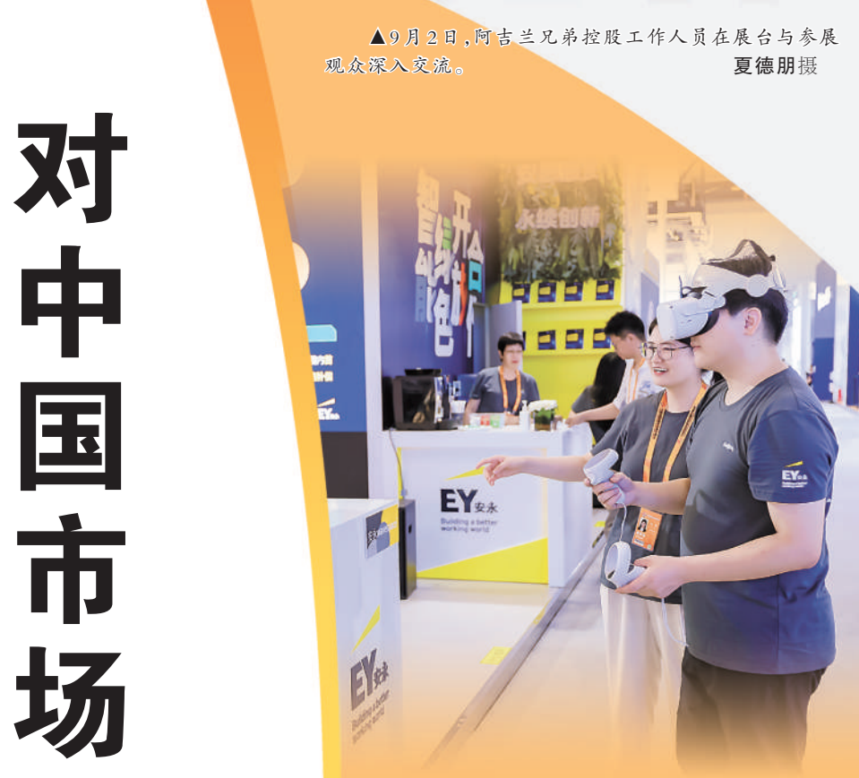
▲9月4日,参展观众在安永集团展台前体验VR装置。