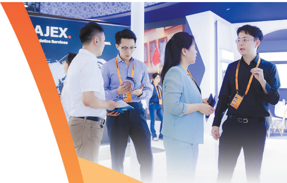
▲9月2日,阿吉兰兄弟控股工作人员在展台与参展观众深入交流。