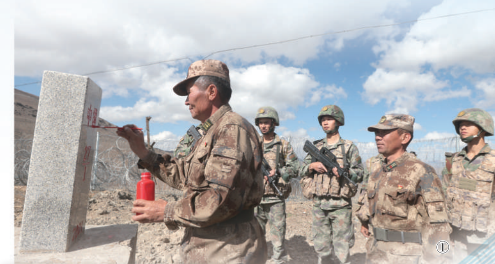
图①：巡逻小分队在描红界碑。