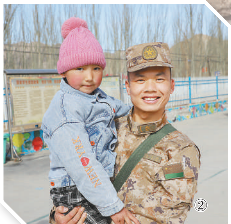
图②：连队官兵与他们帮扶的迈丹小学学生在一起。