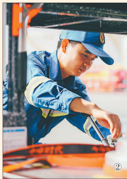
图①:消防员展示模块化前运手段。 图②:专业技术保障分队队员检修消防车水阀。 图③:消防员装卸模块物资。

8月31日,国家综合性消防救援队伍后勤建设成果展在天津举办。本次展览主要包括模块化装备物资调运展示区、营地化生活保障展示区、前置化作战保障展示区等。2018年改革转制以来,国家综合性消防救援队伍完成被装供应、车辆牌证、住房保障等任务,综合保障能力明显提升,基层保障基础有力夯实,后勤管理体系初步构建。