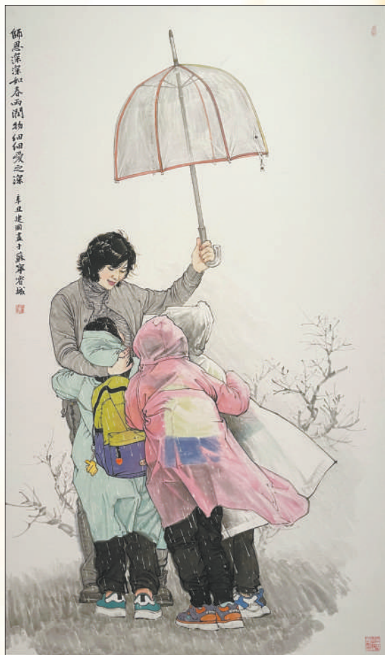
▼ 中国画《春雨》，作者桑建国。