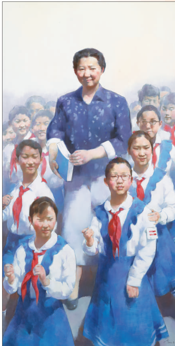
▲ 油画《最美奋斗者——斯霞》，作者陈世宁。