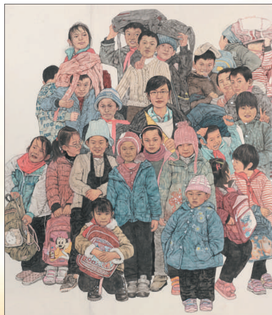
▼ 中国画《支教留念》，作者张春艳。