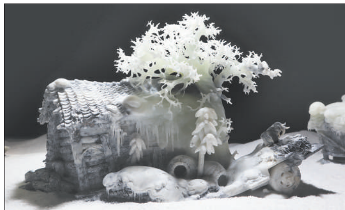
局部，作者唐师。岫岩玉雕《家在东北》系列作品

中国岫岩玉文化产业园一角，几块新开采出的岫玉原料整齐码放在地上，历经亿万岁月沉淀，蕴藏其中的生命之美、自然之美，正等待着在新人新艺的切磋琢磨中绽放光华。