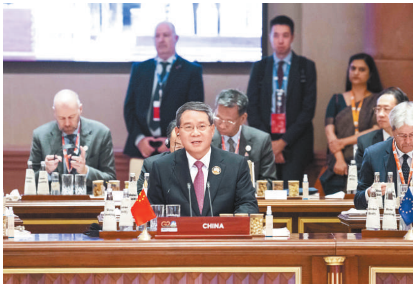
当地时间9月9日上午,国务院总理李强在印度新德里出席二十国集团领导人第十八次峰会第一阶段会议并发表讲话。