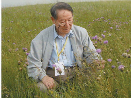
上图：兰州大学任继周教授在草原调研。