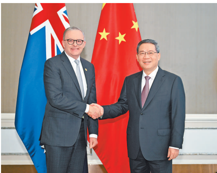
当地时间9月7日上午,国务院总理李强在雅加达出席东亚合作领导人系列会议期间会见澳大利亚总理阿尔巴尼斯。

李强表示,去年11月,习近平主席同总理先生在巴厘岛举行会晤,达成一系列重要共识。近一年来,在双方共同努力下,中澳关系持续呈现积极改善势头。一个健康稳定的中澳关系符合两国人民根本利益和共同愿望。中方愿同澳方抓紧重启和恢复各领域交流,继续推进外交、经贸、教育、领事等领域的机制性对话磋商,为两国关系改善发展提供坚实支撑。坚持在共享机遇中共谋发展,中国将继续扩大高水平对外开放,为包括澳大利亚在内的世界各国提供更大市场,希望澳方对中国企业在澳投资经营采取客观公正态度。双方要本着相互尊重、求同存异、互利共赢的精神妥善处理分歧,推动两国关系进一步改善发展。亚太地区是中国和澳大利亚的共同家园。中方愿与澳方一道努力,共同维护亚太和平稳定。