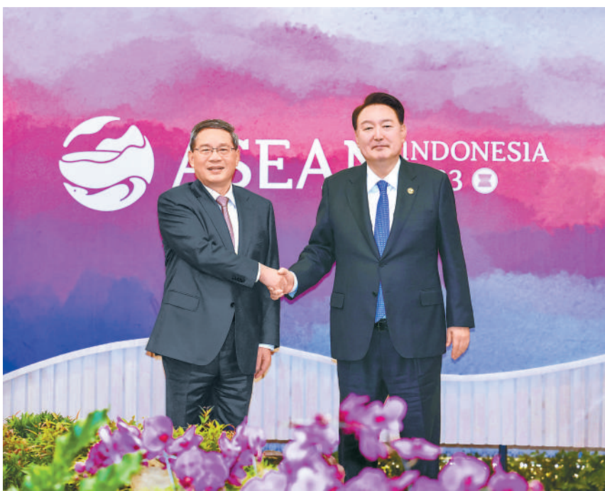
当地时间9月7日下午,国务院总理李强在雅加达出席东亚合作领导人系列会议期间会见韩国总统尹锡悦。

尹锡悦预祝杭州亚运会圆满成功,表示韩中关系过去30年取得巨大发展,惠及两国和两国人民。韩方愿同中方一道,加强各层级沟通对话,深