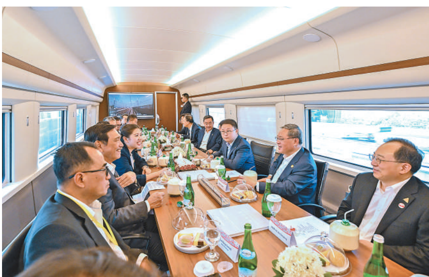
当地时间9月6日下午,正在印度尼西亚访问的国务院总理李强考察中印尼合作项目雅万高铁。印尼对华合作牵头人、统筹部长卢胡特,交通部长布迪陪同考察。