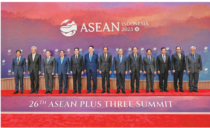
当地时间9月6日下午,国务院总理李强在印度尼西亚雅加达出席第26次东盟与中日韩(10+3)领导人会议。这是会前集体合影。