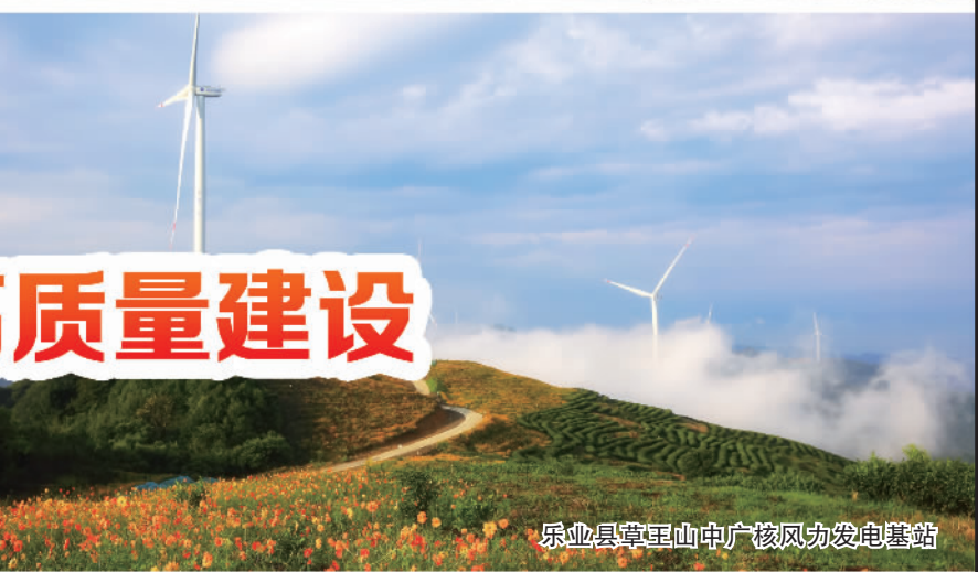
乐业县章堂山中广核风力发电基地