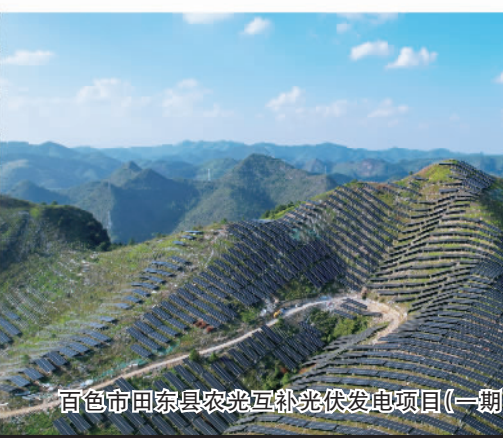
百色市田东县农光互补光伏发电项目(一期)

验区获批以来,累计新增高速公路474公里,高速公路总里程达1175公里,位居广西第2位。西部陆海新通道标志性工程黄桶—百色铁路计划年内开工建设。右江千吨级黄金水道基本建成,投资50亿元的百色水利枢纽通航工程将于2026年与平陆运河同步建成。