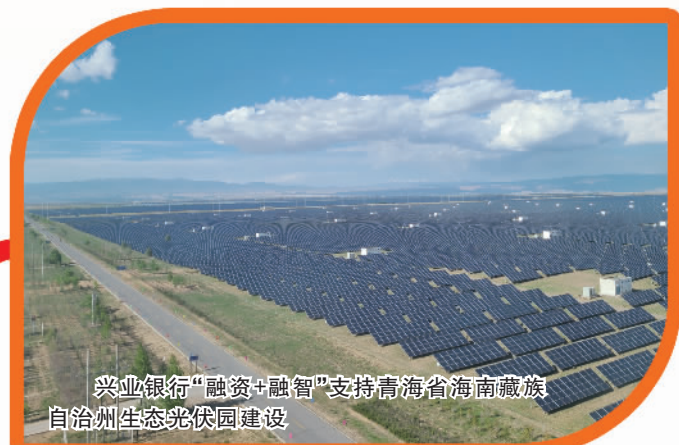
兴业银行“融资+融智”支持青海省海南藏族自治州生态光伏园建设