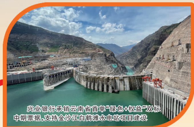
兴业银行承销云南省首单“绿色+权益”双标中期票据，支持金沙江白鹤滩水电站项目建设