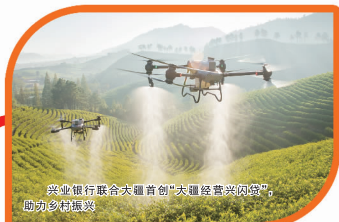
兴业银行联合大疆首创“大疆经营兴闪贷”，助力乡村振兴