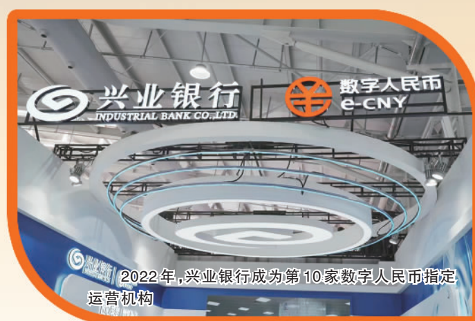
2022年，兴业银行成为第10家数字人民币指定运营机构

目前，兴业银行总资产近10万亿元，年实现净利润超900亿元；2022年末，各项存款余额4.74万亿元，各项贷款余额4.98万亿元；累计现金分红超过1700亿元，累计纳税近4000亿元。