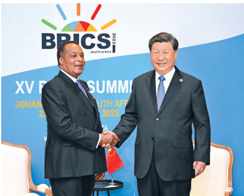
当地时间8月24日上午,国家主席习近平在约翰内斯堡出席金砖国家领导人会晤期间会见刚果(布)总统萨苏。