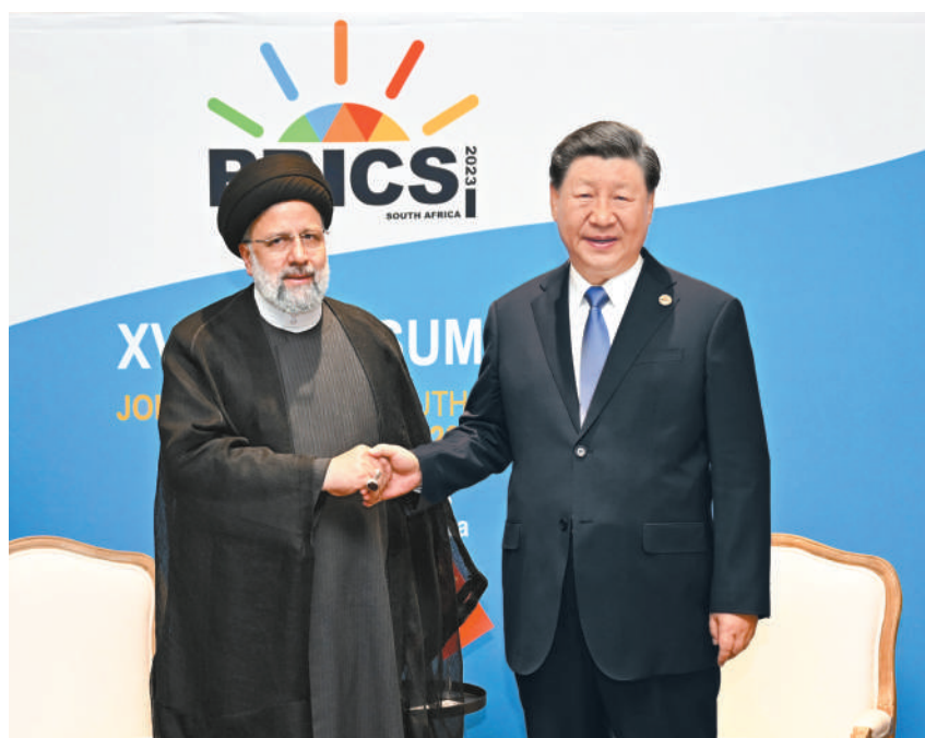
当地时间8月24日上午,国家主席习近平在约翰内斯堡出席金砖国家领导人会晤期间会见伊朗总统莱希。