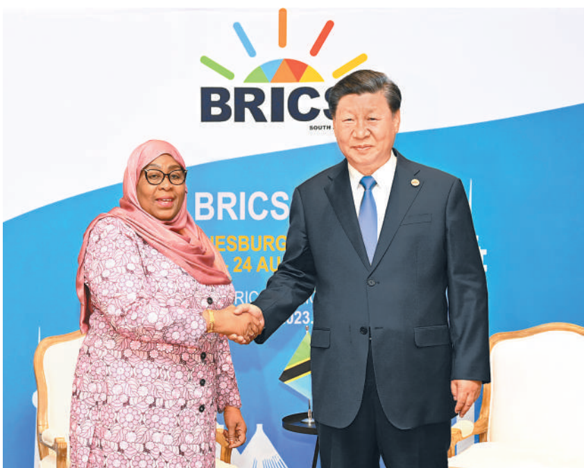
当地时间8月24日上午,国家主席习近平在约翰内斯堡出席金砖国家领导人会晤期间会见坦桑尼亚总统哈桑。

(上接第一版)坦赞铁路是两国人民的共同美好记忆。明年是中坦建交60周年,中方愿以共同庆祝建交60周年为契机,同坦方继续坚定支持彼此核心利益和重大