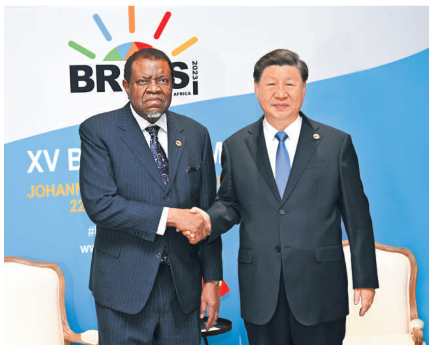
当地时间8月24日上午,国家主席习近平在约翰内斯堡出席金砖国家领导人会晤期间会见纳米比亚总统根哥布。