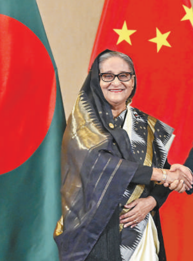
当地时间8月23日下午,国家主席习近平在约翰内斯堡出席金砖国家领导人会晤期间会见孟加拉国总理哈西娜。

本报约翰内斯堡8月23日电(记者邹松、万宇)当地时间8月23日下午,国家主席习近平在约翰内斯堡出席金砖国家领导人会晤期间会见孟加拉国总理哈西娜。