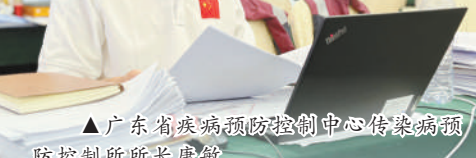
►广东省疾病预防控制中心传染病预防控制所所长康敏