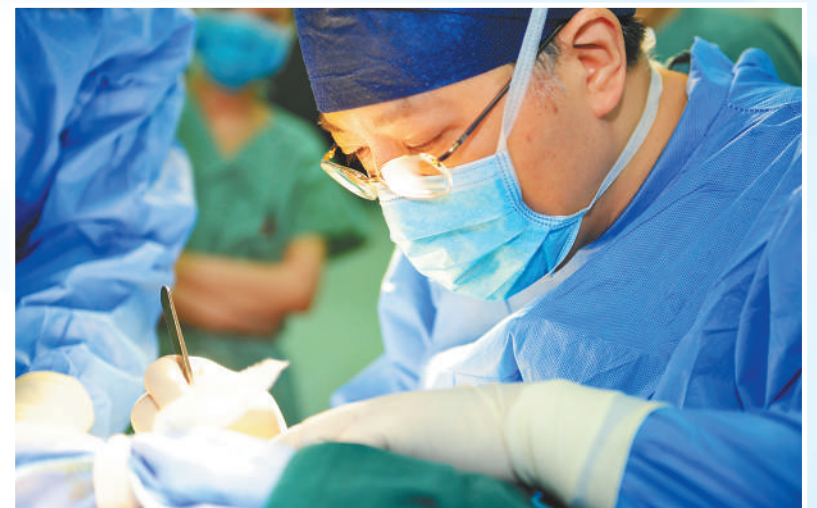
复旦大学附属肿瘤医院乳腺外科主任邵志敏在手术中。