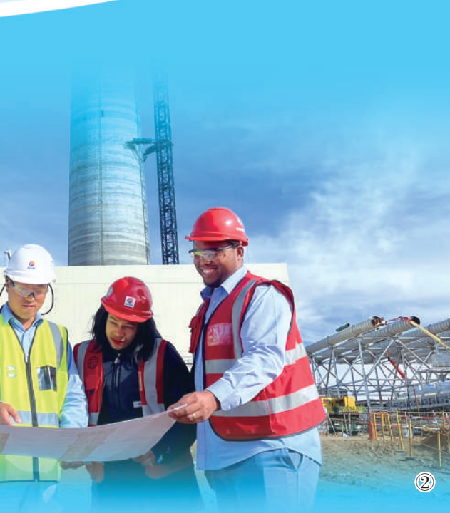
图2:在中企承建的南非红石光热项目现场,中南双方员工就光塔施工工序问题进行探讨。