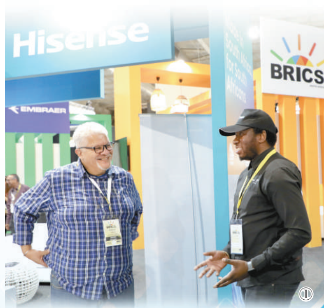
图1:8月21日,在金砖国家贸易博览会上,参观者在海信展台前交谈。