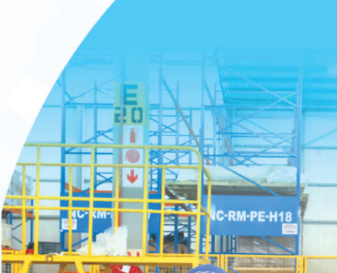
图3:一名南非女工在一汽南非工厂总装车间内工作。

南非贸易、工业和竞争部副部长吉娜说:“海信在开普敦建立产业园区后,实现了自身快速发