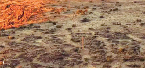
图5:德阿风电项目远景。