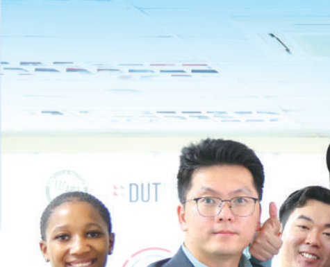
图4:南非德班理工大学孔子学院部分师生合影。