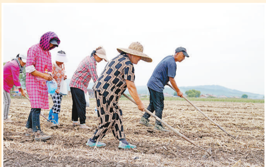
▶8月21日，吉林省舒兰市开原镇新开村，村民在平整后的土地上播撒小萝卜种子，通过改种生长期较短的农作物弥补受灾损失。