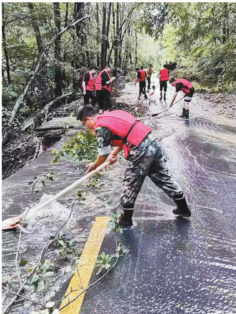
▲8月17日，黑龙江省尚志市党员干部、志愿者在清理道路。