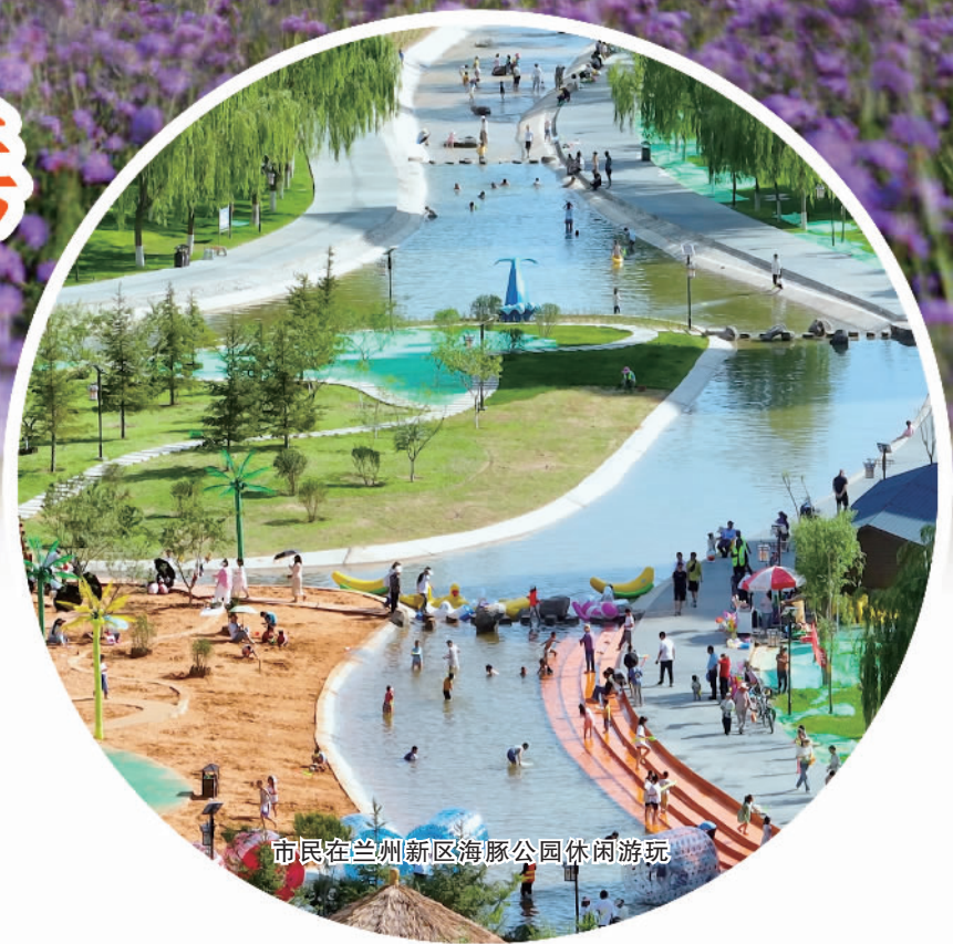
市民在兰州新区海豚公园休闲游玩

坚定不移担起建设美丽新甘肃、幸福新陇原使命，统筹推进强省会行动，助推兰西城市群区域发展，筑牢黄河上游生态屏障，兰州新区将重点聚产业、惠民生、强生态、引人才，谱写国家级新区高质量跨越式发展新篇章。