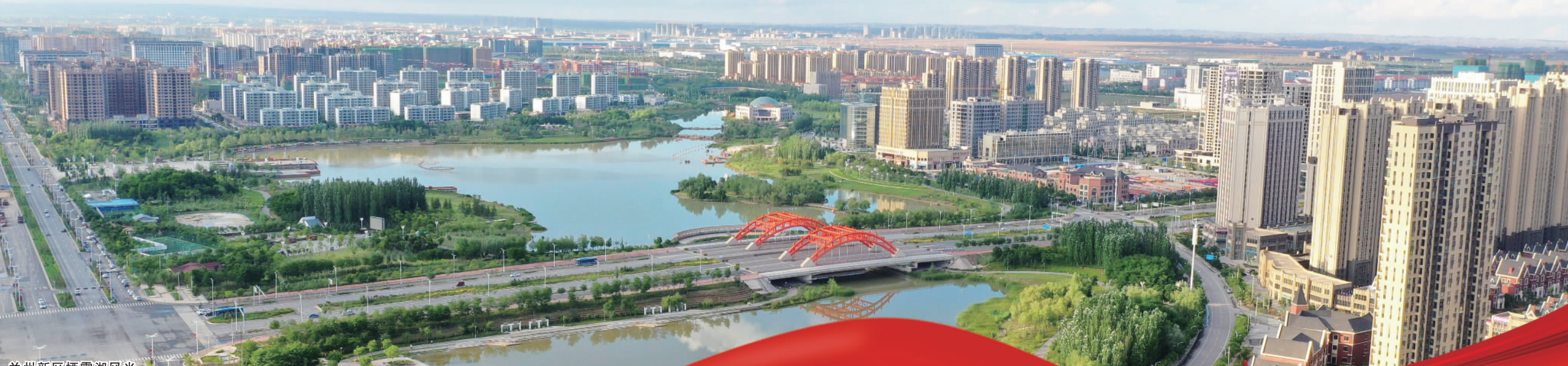
兰州新区栖霞湖风光