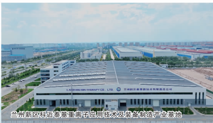
兰州新区科近泰基重离子应用技术及装备制造产业基地