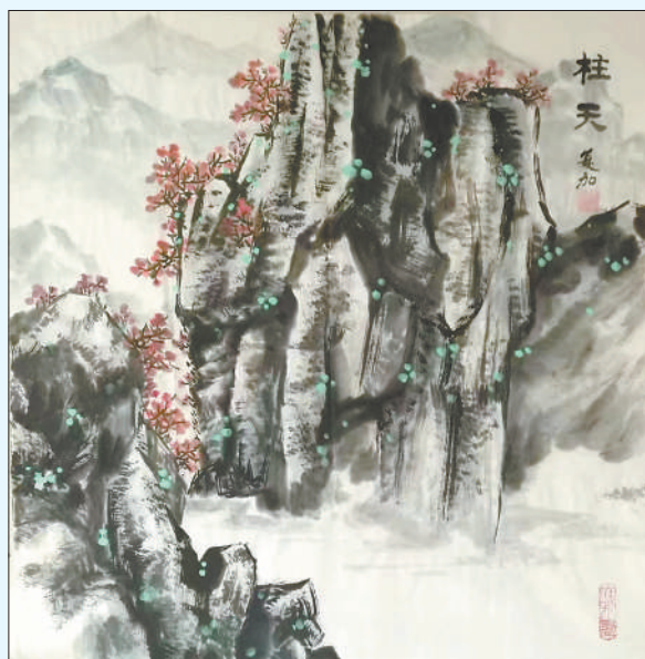
▲中国画《柱天》,作者冯复加。