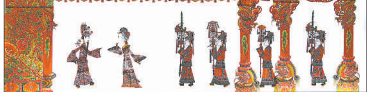
▼华州皮影《金殿》。