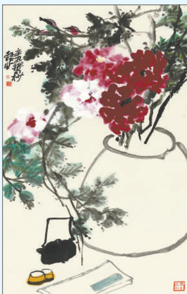
▲中国画《茶空间》,作者姚晓冬。