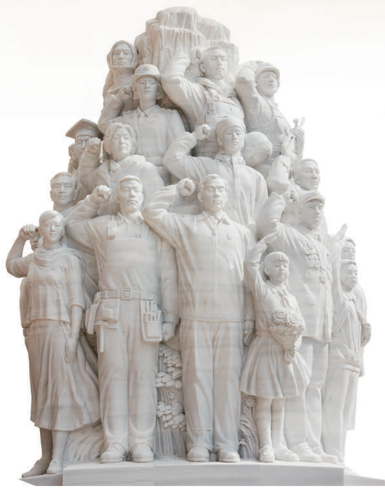
▲中国共产党历史展览馆西侧广场大型组雕《信仰》,中央美术学院团队集体创作。 ▼中央美术学院师生在江西省赣州市上犹县紫阳乡秀罗村建筑立面上创作墙绘。

构建“弘扬中华美育精神新学科”,是中央美术学院引领高等美术教育内涵式发展的重要举措,注重在教学中贯穿美育、艺术创作中突出美育、学术研究上重视美育、服务社会上彰显美育、文化传承上弘扬美育。学院启动美育学学科建设,成立美育研究院,为本科生开设“美育导论”必修课,为研究生开设“马克思主义美育研究专题”等课程,招收“中华美育研