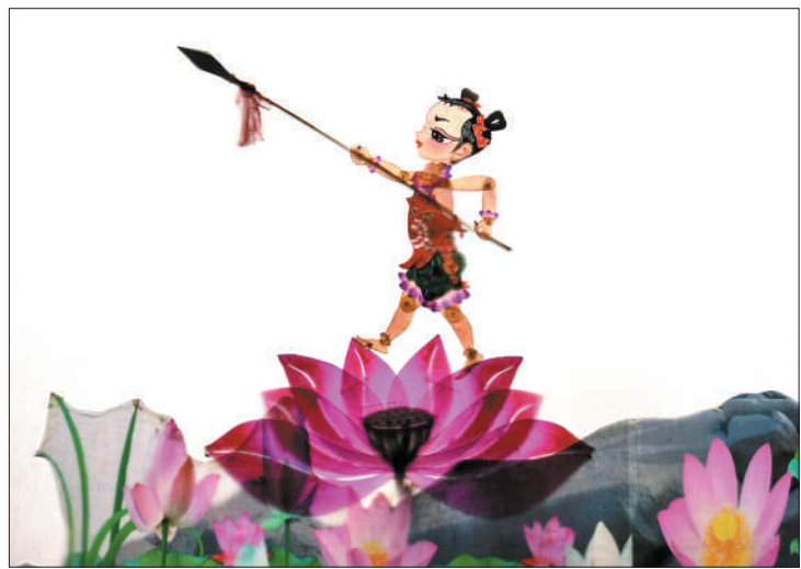
▲大型原创多媒体皮影剧《善恶扬善小哪吒》剧照。