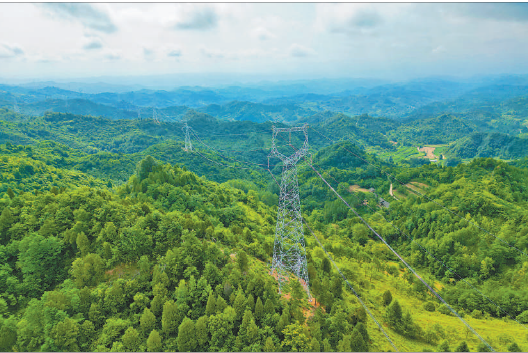
近日，甘肃陇南一项330千伏线路工程全线贯通。该工程计划今年10月投运，将有效推动白龙江流域水电负荷就地消纳，促进地区清洁能源发展，实现生态与经济建设双赢。